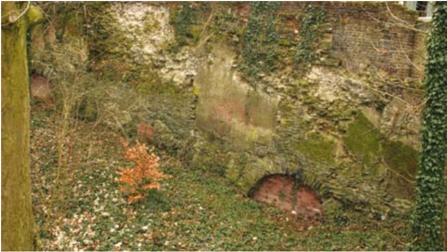
Resten van de stadsmuur met funderingsbogen in het abdijpark

verschil tussen een toren en een rondeel was klein: een rondeel had dezelfde hoogte als de muur, terwijl een toren minstens één verdieping hoger was. Sommige torens werden ook voor andere doeleinden gebruikt, als opslagplaats, wapenkamer, archief of gevangenis. Ze waren dan ook aan de stadszijde gesloten en kregen een dak. Andere torens kwamen in de loop der jaren