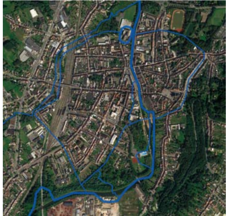
Hydrologie in de late middeleeuwen

Op dit ogenblik kunnen we dit slechts als een hypothese naar voor schuiven. Hopelijk kan het archeologisch onderzoek ons meer inzicht verschaffen over de precieze relatie tussen de Pijntoren, de binnenmolens en de waterlopen in de Dendervallei.