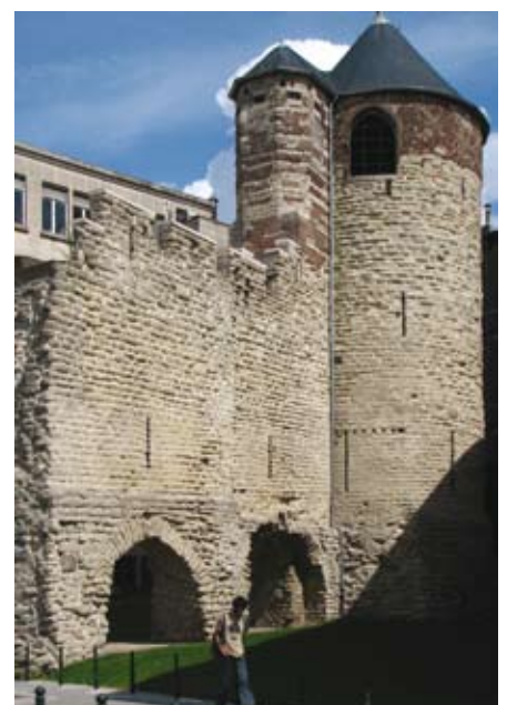
De Anneessenstoren gezien vanaf de buitenzijde. De schietgaten bieden zijdelings schietbereik.