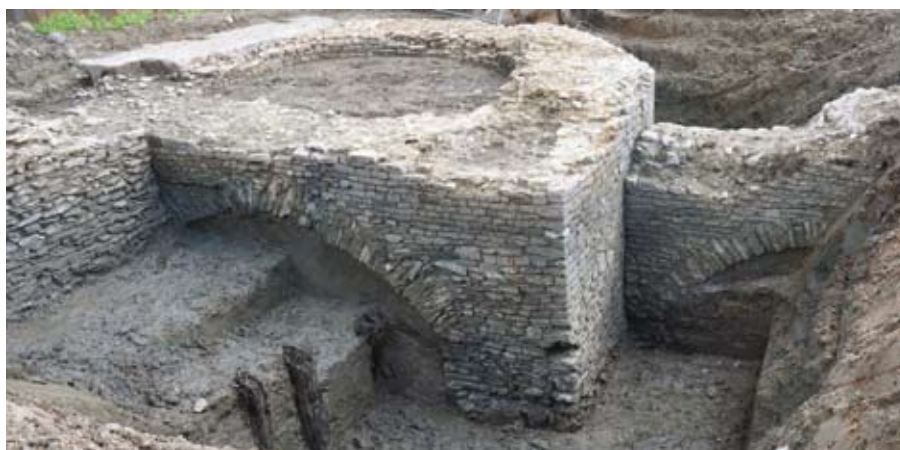
Bij de opgravingen van de Pijntoren blijkt de muur duidelijk tegen de toren aan gebouwd

Het beleg van Oudenaarde door de hertog van Parma in 1582. Ten opzichte van de middeleeuwse verdedigingsgordel zijn de walgrachten verbreed en voorzien van driehoekige bastions.