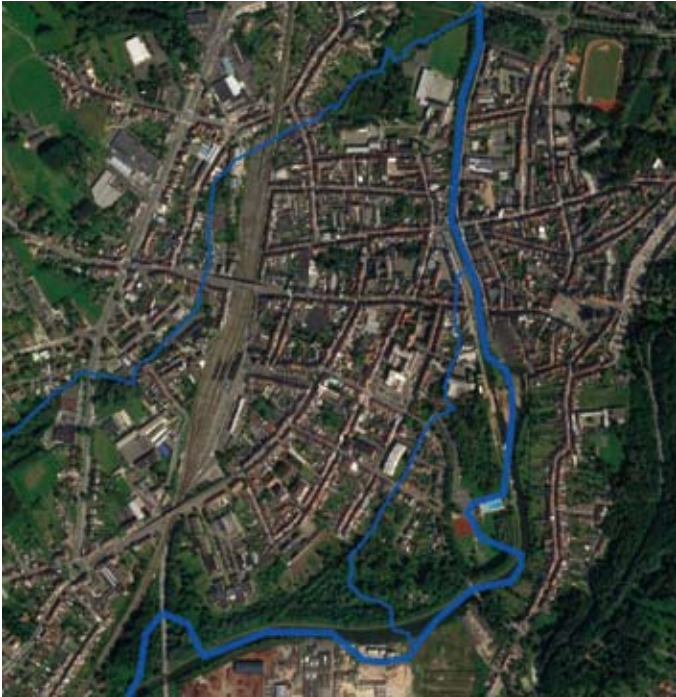
Hydrologie in de vroege middeleeuwen