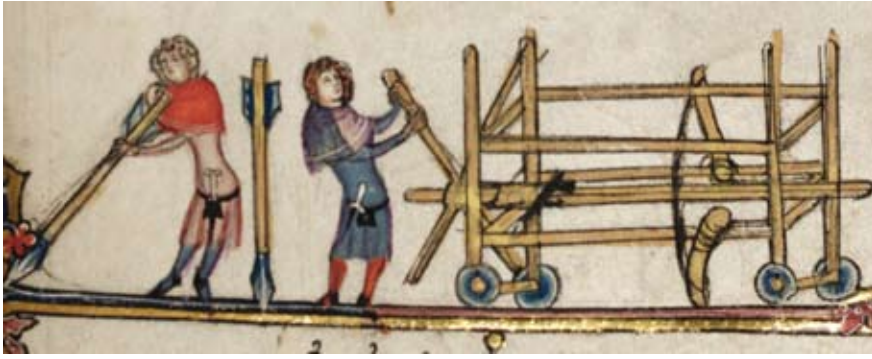
Terwijl een verdediger het springaal opspant, neemt een andere alvast een pijl. (miniaturfragment uit "The Romance of Alexander", 1338-1344, Bodleian Library)

rondelen of de torens, waarmee zware pijlen konden worden weggeschoten. Geraardsbergen beschikte dus over een prima defensieve structuur. Ter vergelijking: Aalst was op dat ogenblik maar voor de helft ommuurd en beschikte over slechts 10 kruisbogen en 5 springalen.