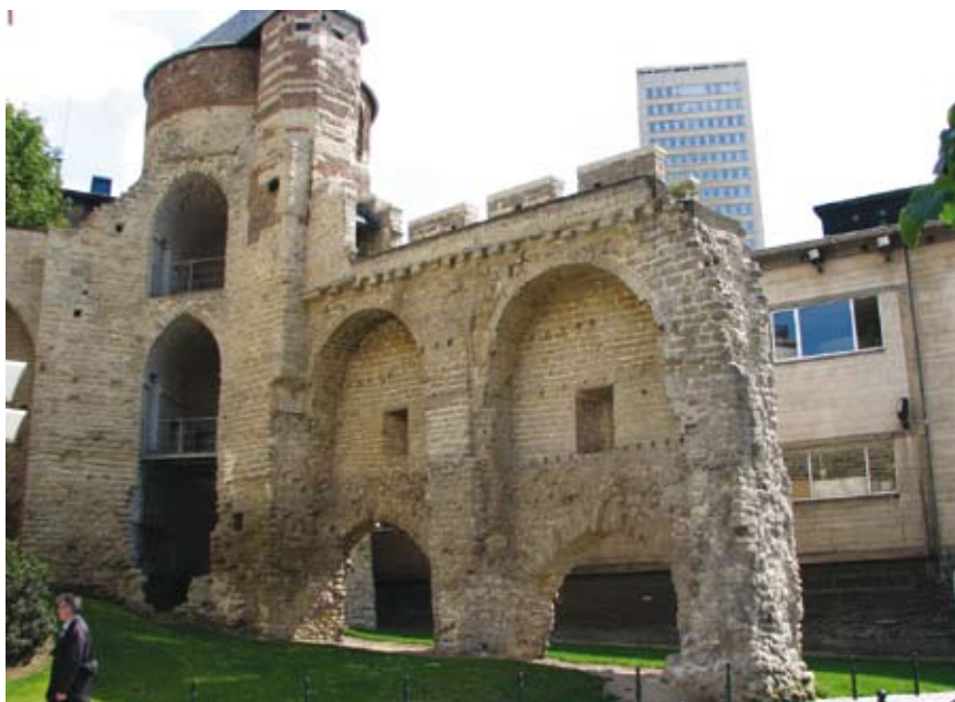
De Anneessenstoren maakte deel uit van de eerste stadswalling van Brussel. We zien vanaf de stadszijde de toren en twee resterende steunbogen van de walmuur. De onderste bogen zijn funderingsbogen die zich destijds onder de grond bevonden! De walmuur is bekroond met een weergang en kantelen.

De fasering bestond erin dat men startte met het graven van de grachten en het opwerpen van aarden wallen. Deze boden een snel realiseerbare verdedigingslinie. Eventueel werden de wallen nog versterkt met een houten palissade. Vervolgens werden de meest kwetsbare