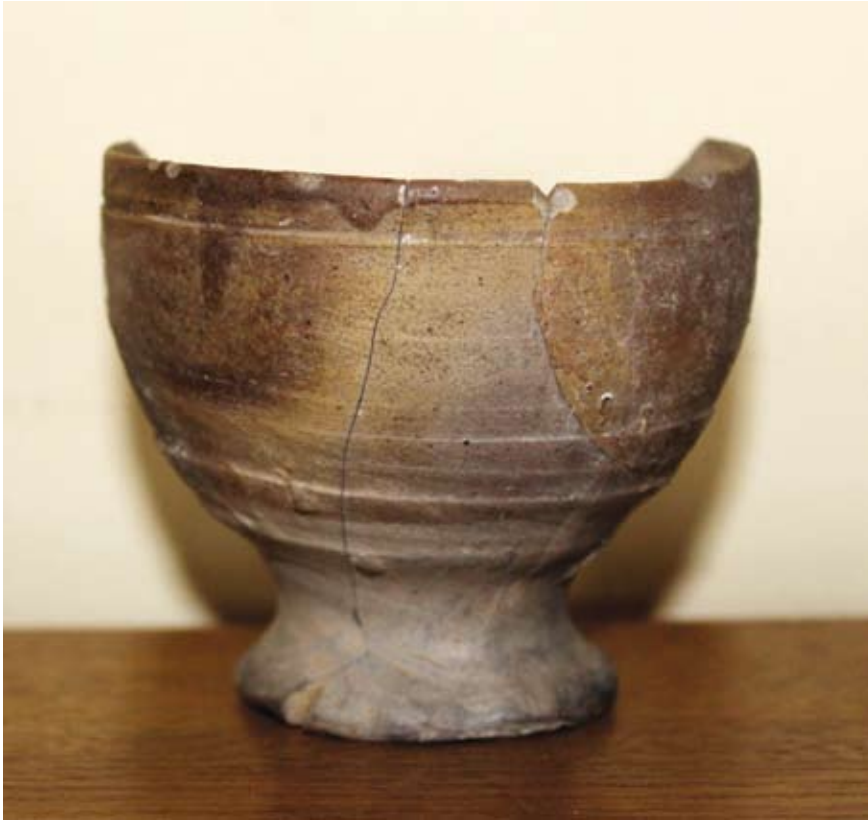
Drinkbeker uit Siegburg, gevonden in Geraardsbergen