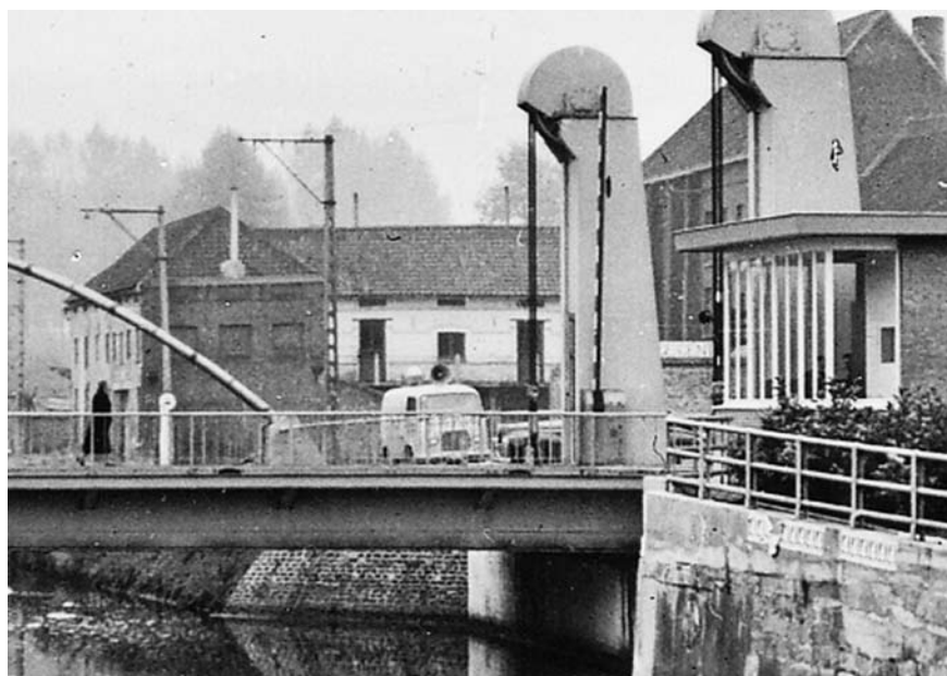
De KSA verhuisde in de jaren 1970 naar de gebouwen van de vroegere hout-handel Flamée aan de Sasweg. In de jaren 1980 werd dit complex afgebroken om plaats te maken voor de Aldi en nog later de Wibra.

unicum in de KSA geschiedenis. Nooit verscheen het bondsblad zo regelmatig om de twee maand en dit decennia lang. De medewerking van leden en leiding hieraan is dan ook groot geweest.