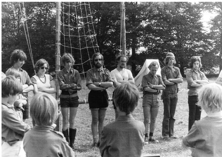
Opening van het eerste kamp na de splitsing te Mariembourg (1973)