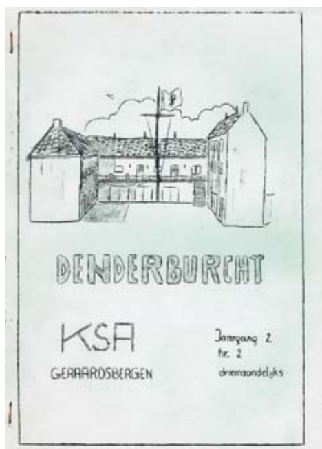
Voorblad van het bondsblad 'Denderburcht' met daarop een tekening van de KSA lokalen aan de Sasweg 2