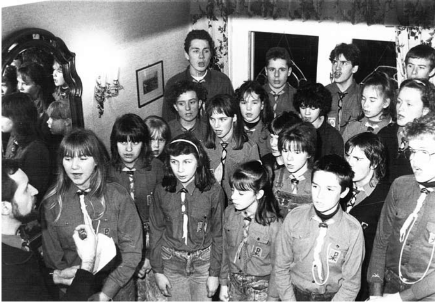
Kerstzang bij een sympathisant (Vermoedelijk 1987-1988)