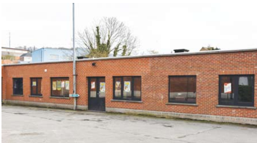
Het nieuwe lokaal aan de ingang van het Sint-Jozefinstituut, opgetrokken vanaf 1962. In 1973 zal 'Chiro Sint-Bartel' er haar intrek nemen. (Foto J. De Lil, 25 februari 2017)

Dit contact met de gouw leidt voor de Sint-Jozefsbond een vernieuwde bloei in.