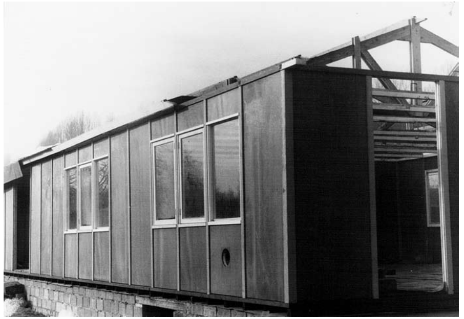
Het nieuwe lokaal in de tuin van de pastorie van Onkerzele in aanbouw (1983)