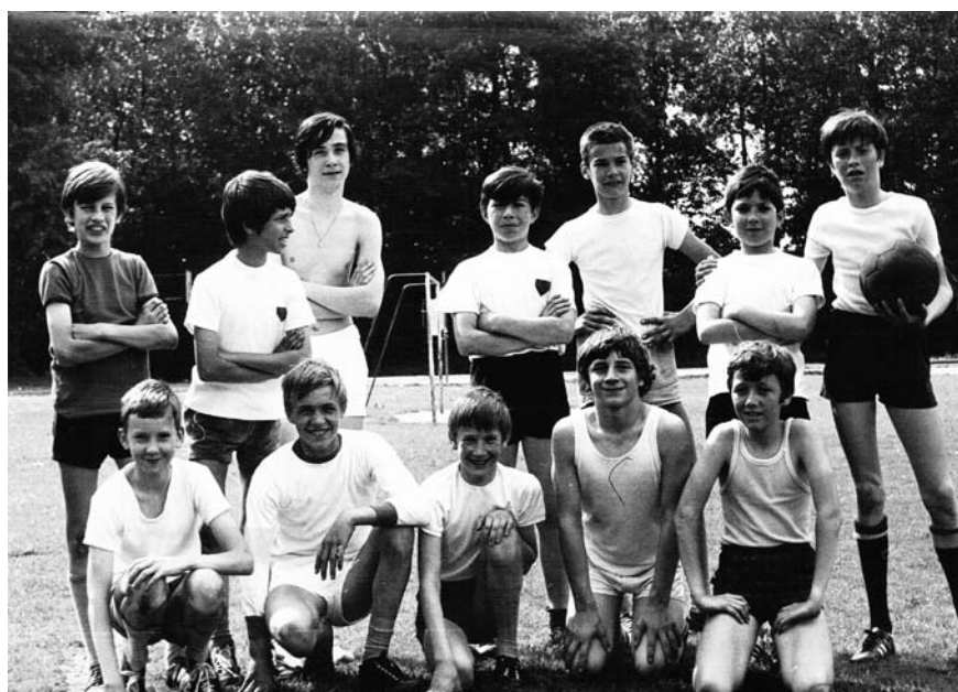
De voetbalploeg van de 'Knapen' (jaren 1970)