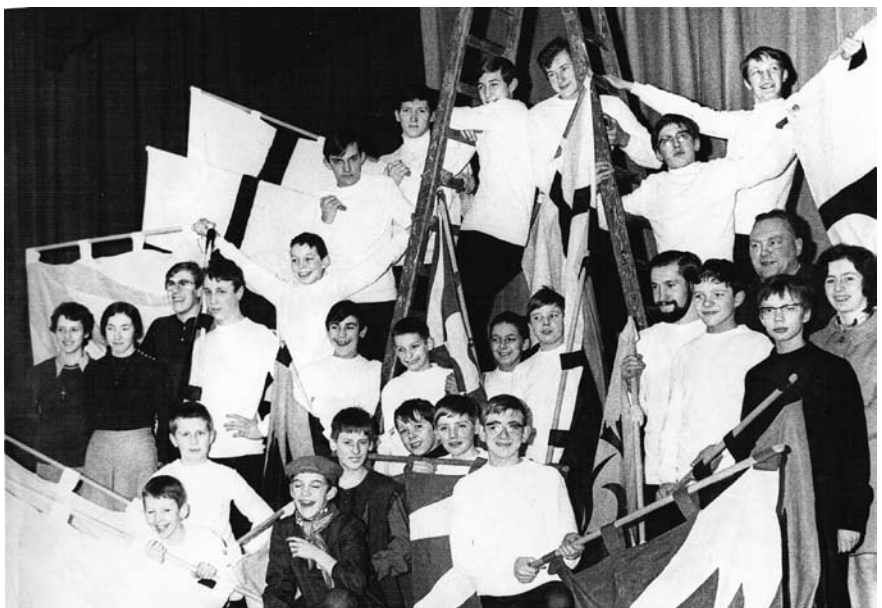
De Vendeliersgroep Bart (1970)

nieuwe wind voelden waaien. Het uniform kwam zeer zwaar ter discussie te staan... men eiste inspraak, democratie, gemengde werking... Het gezag werd aan het wankelen gebracht. Begrijpelijk dat veel schooldirecties, leraren, zelfs proosten van jeugdbewegingen dit met lede ogen aanschouwden. In KSA Sint-Jozef stapelden de problemen met de Hernieuwers zich verder op. Er werd naar nieuwe maar soms ongelukkige formules gezocht. De uitwerking stagneerde en velen zagen het niet meer zitten; het lastige kind van de bond zou nog voor heel wat problemen zorgen in de nabije toekomst. Om de werking op dreef te krijgen en om tegemoet te komen aan de eis van gemengde werking, werden eind de jaren 1960 de eerste meisjes bij de Hernieuwers toegelaten. Een hele revolutie. Hoe modern in die tijd misschien ook, veel soelaas heeft het niet gebracht. Maar wat wil je? Meisjes waren in die tijd voor jongens totaal onbekende wezens en vice versa. Dit jaar trokken we op kamp naar La Berlière, buitenverblijf van de paters jozefieten te Houtaing. Maar het pronkstuk van dit werkjaar werd zeker de trektocht naar Spanje. Met de fiets trokken we er