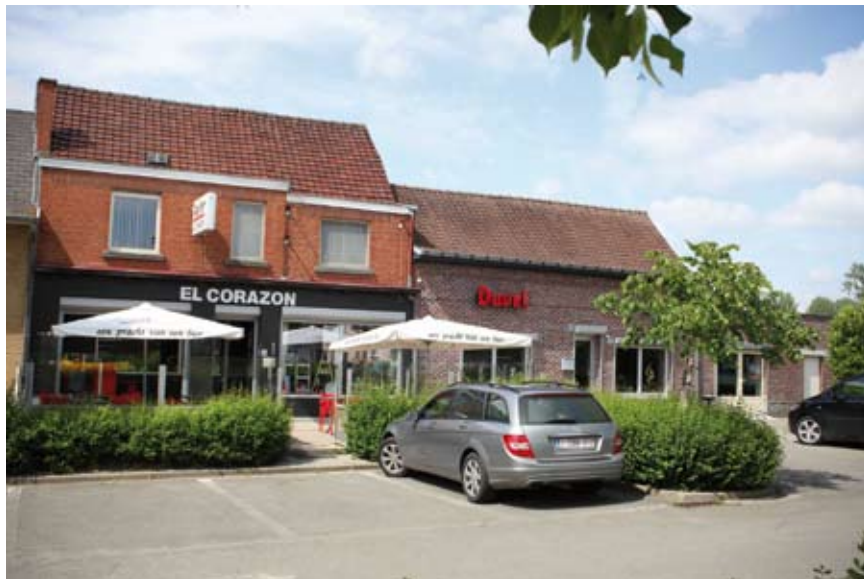
Duivenlokaal Eerlijk Duurt Langst in het Café El Corazón (foto Johan François, 2016)

Een Reglement van den Duivenbond "De Vereenigde Duivenliefhebbers van Overboulare" gevestigd bij Pierre Van De Ponsele, Groote Baan te Overboulare werd op 13 juli 1922 aan het gemeentebestuur overgemaakt en op 17 december aan de algemene vergadering voorgelegd en goedgekeurd. Het is echter niet duidelijk of de duivenmaatschappij al eerder bestond dan wel dat het reglement is opgesteld naar aanleiding van een mogelijke stichting van de duivenmaatschappij. Er is echter sprake van een erevoorzitter wat ons doet vermoeden