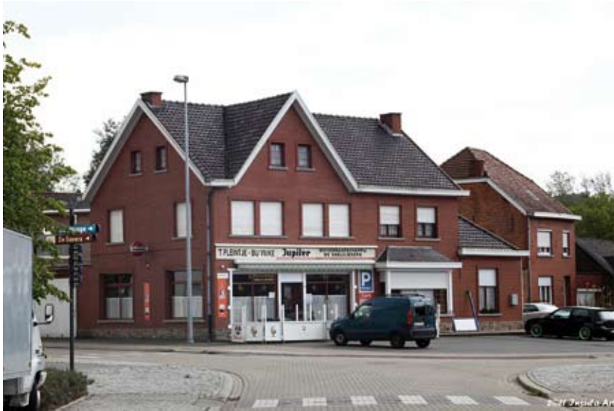
Duivenlokaal De Snelvliegers in Zandbergen (foto Johan François, 2016)

aanwezig. Waarom wordt zo weinig belang gehecht aan de lokale organisaties? En waarom zijn de leden amper of niet geïnteresseerd in de geschiedenis van hun eigen vereniging? Dient in beginsel een vereniging tot ondersteuning van het sociale aspect, een verbondenheid dat het spelen met de duiven met zich meebracht, dan is dit, zeker na de Eerste Wereldoorlog geëvolueerd naar een dienstenleverancier die instaat – net als de Koninklijke Belgische Duivenliefhebbersbond (KBDB) – voor het innen van de lidgelden, de taksen, de (electronische) ringen, de administratieve afhandeling van de talrijke lijsten enz.. Toch hebben de plaatselijke duivenmaatschappijen hun belang.