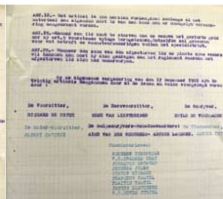
Reglement van den Duivenbond "De Verenigde duivenliefhebbers van Overboulare" (december 1922)