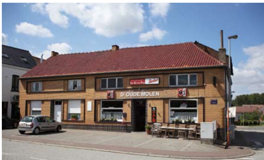
De melkers van de maatschappij De Witte Pen hebben hun til in d'Oude Molen in Zarlardinghe.