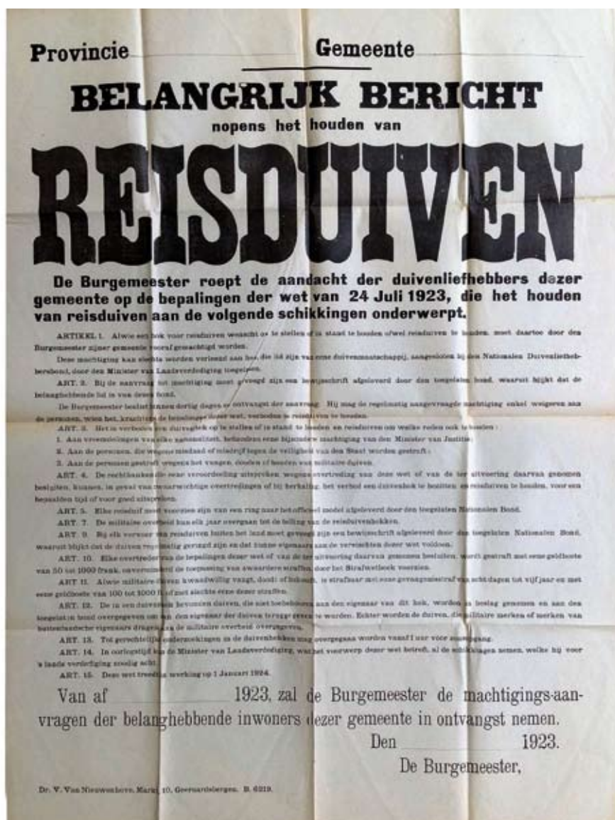
Affiche met betrekking tot het houden van reisduiven in het kader van de wet van 24 juli 1923