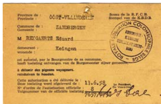
Toelating van de burgemeester van Zandbergen om reisduiven te houden, met de stempel van de Koninklijke Belgische Duivenliefhebbersbond, 1958