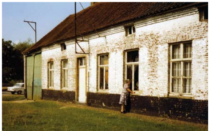
Hof te Hoogvorst - 1982