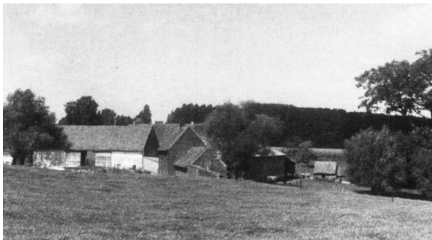
Het Hof te Steenborre

Looze ook dit goed en laat er in 1864 na het rooien van het bos eveneens een gesloten hofstede bouwen. Deze gold naar verluidt als model voor een rationele landbouwuitbating.