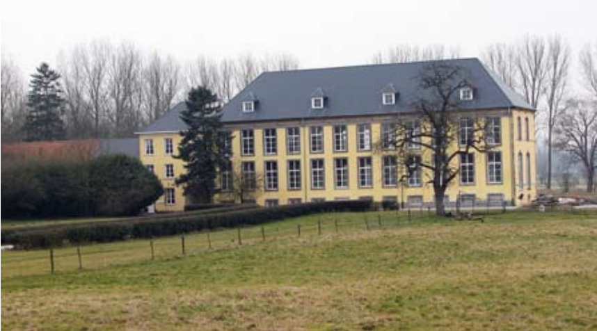
Kasteel Beaupré: het voormalig gastenkwartier van de abdij

van hakhout, het bos is daarvoor in 'tailen' ingedeeld, levert de kloosterlingen een aardige stuiver op. Het kloosterpand wordt dan als volgt beschreven: 'een beluyckte, groot vier bunderen, twee dachwanden ende xxxiii roeden, met de kercke ende tkerkhof ende edifficien ende huysinghen als de cameran, twasch- ende backhuys, brauwerye, gastencamere, duyfhuys, schueren, stallen, smesse, waghenuys ende poorte' .