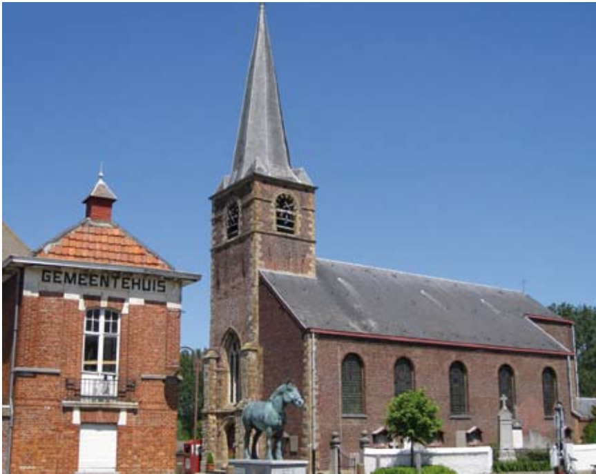
Kerk, gemeentehuis en Orange I

centraal bekroond met een driehoekig fronton voorzien van het wapenschild van de gemeente en opschrift gemeentehuis . In een nis van het gebouw bevindt zich een openbaar toilet en voor de gevel staat de roepsteen waarop vroeger de champetter berichten verlas. Na het slopen van de oude herberg De Swaene wordt in 1926 links een vleugel bijgebouwd.