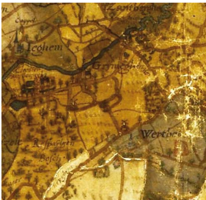
Grimminge (Detail uit de Horenbaultkaart van het Land van Aalst - 1595) We zien centraal ten zuiden van de Dender de kerk van Grimminge. Links daarvan bevindt zich het klooster van Beaupré. De Houtenklopmolen vinden we centraal bijna aan de rand van het uitgestrekte Raspaillebos.