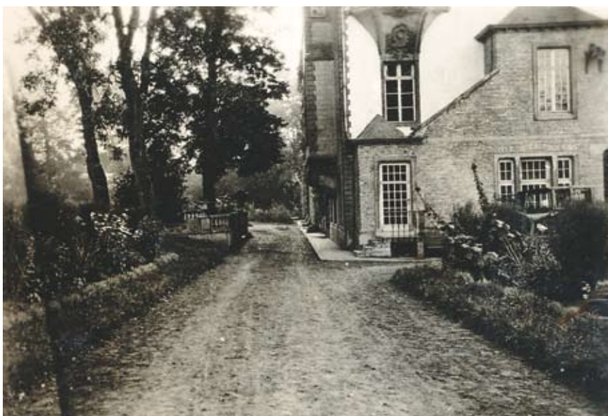
De achtergevel van het Sint-Adriaanskasteel voor de inkwartiering van de Britse soldaten (ongedateerd)