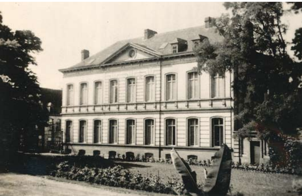
De herenwoning Abdijsstraat 16, gebouwd in 1873, voor de komst van het Britse leger (ongedateerd)