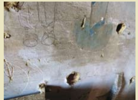
Graffiti met vermelding Royal Corps of Signals, ingekerfd op een muur van de zolderverdieping van het abtenkwartier