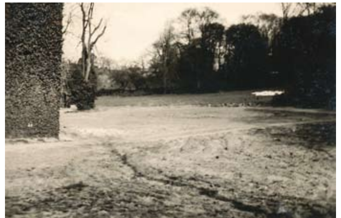
Van het grasveld achter het abtenhuis is na de komst van het Britse leger niets meer te merken (ongedateerd)

konden betekenen voor het latere abdijmuseum.