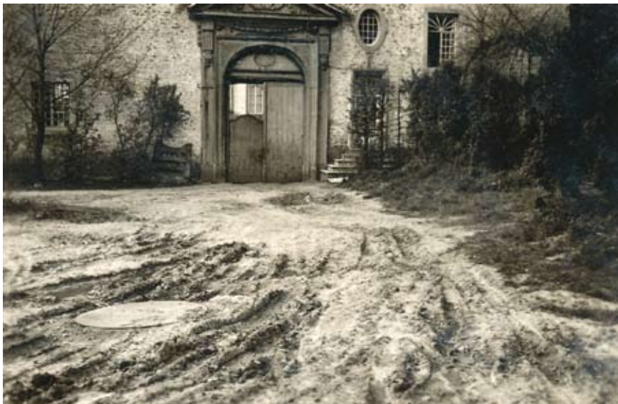
De hovingen tussen het portiershuis en de Abdijstraat voor en na de komst van het Britse leger (ongedateerd)

Dankzij de inventaris die notaris Rens in oktober 1945, net voor de inkwartiering van de Britse soldaten, heeft opgemaakt van alle roerende goederen in het Sint-Adriaanskasteel, hebben de vruchtgebruikers nauwkeurig kunnen nagaan welke objecten er beschadigd en welke er verdwenen zijn. In het schadedossier is deze inventaris opgenomen maar met aanduiding van hun actuele staat ('beschadigd' of 'verdwenen') met daarnaast hun geschatte geldwaarde. De totale som bedraagt 141.690 fr.. Onze belangstelling gaat vooral naar de verdwenen voorwerpen, waarvan sommige wellicht een meerwaarde