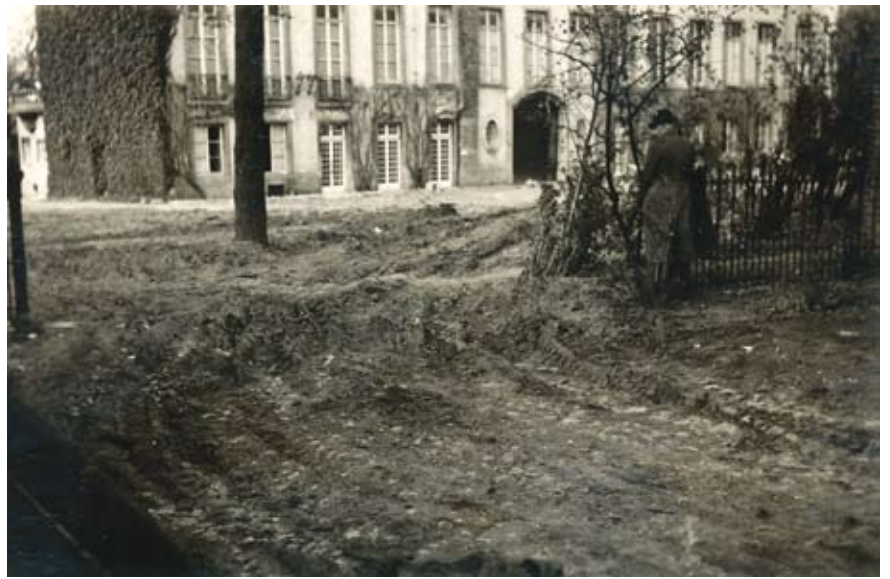
De tuin voor het Sint-Adriaanskasteel voor en na de inkwartiering van de Engelsen (ongedateerd)