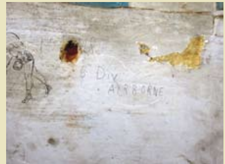
Graffiti met vermelding Airborne Division op een muur van de zolderverdieping van het abtenkwartier