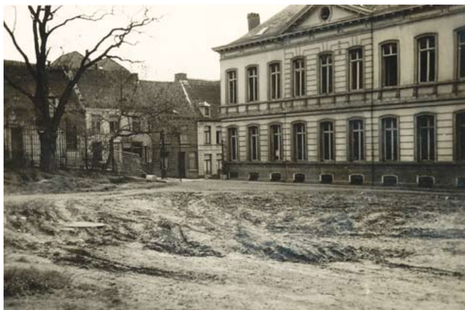
De herenwoning Abdijstraat 16 na het vertrek van het Britse leger (ongedateerd)

In de herenwoning Abdijstraat 16 zijn in de kelderverdieping, die 5