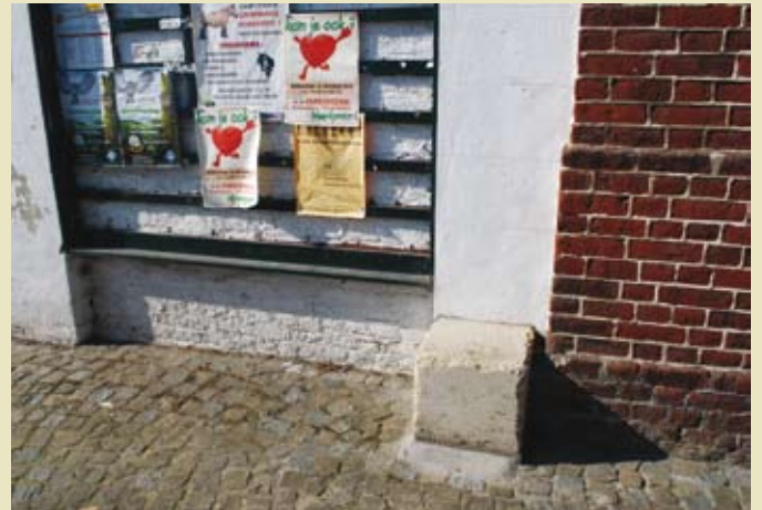
De roepsteen voor het voormalig gemeentehuis te Grimminge