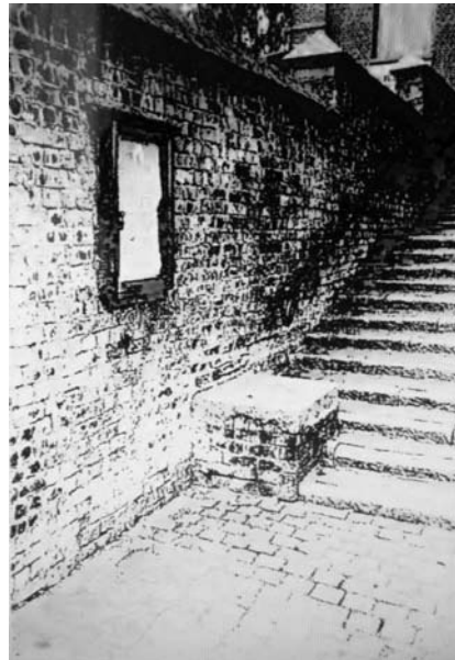
Roepsteen met mededelingenbord op de trappen naar de Sint-Martinuskerk te Onkerzele (1986)