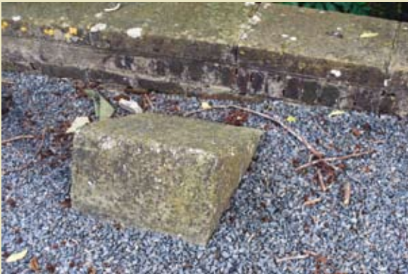
De verzonken roeptribune voor de Sint-Amanduskerk te Waarbeke