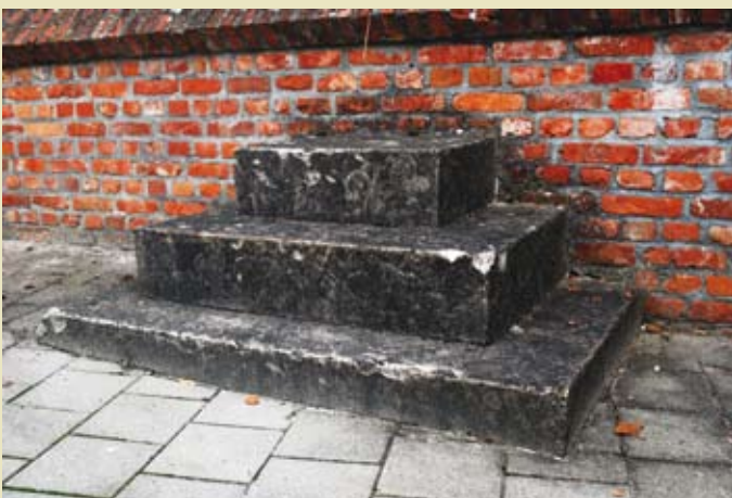
De roepsteen in trapvorm voor de kerkhofmuur te Overboelare