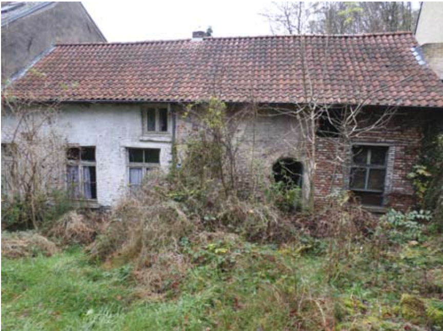
De voormalige woning van Pietje Stek met verwaarloosde voortuin in de Oudenbergstraat (27 november 2015)