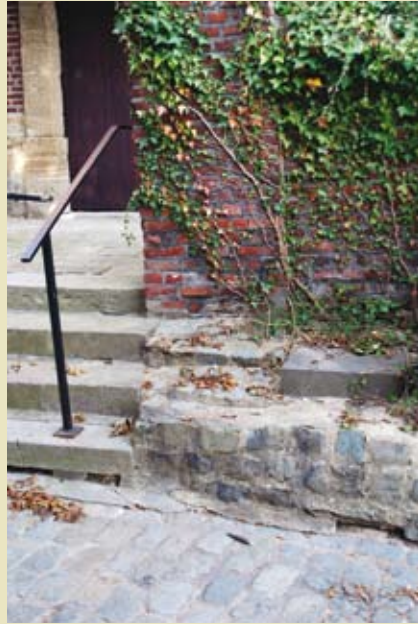
De roepsteen naast de trap naar de Sint-Amanduskerk te Smeerebbe