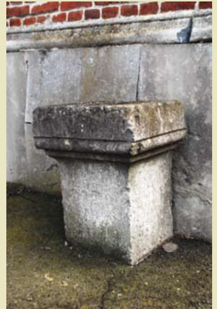
De roepsteen voor de Sint-Amanduskerk te Viane