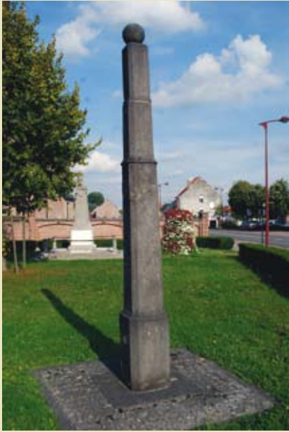
De schandpaal voor de Sint-Pietersbandenkerk te Ophasselt