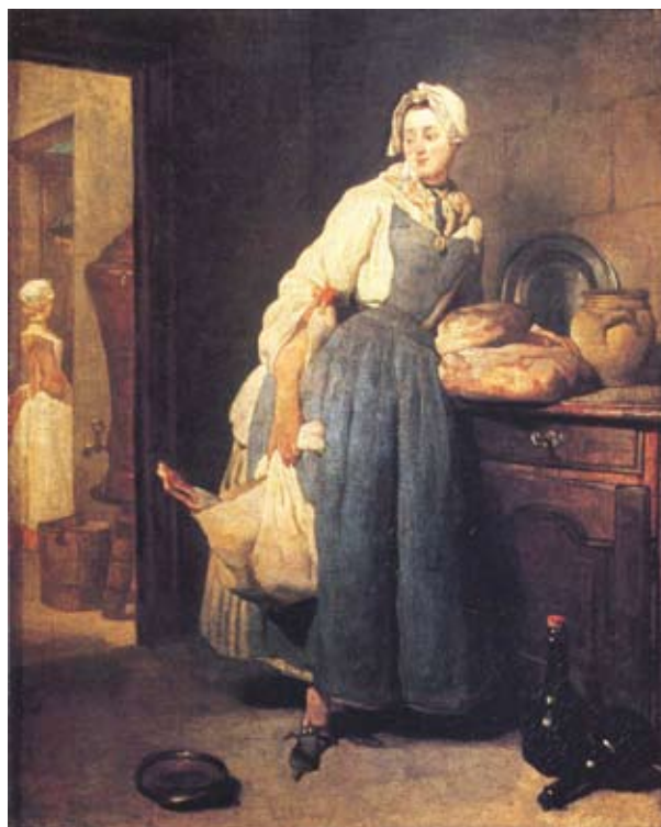
DE TERUGKEER VAN DE MARKT

Als eetgerei vinden we er vier thene taillooren (tinnen borden waarop het vlees wordt gesneden), een comme en souplepel , alle het geleijerde (gleiswerk, verglaasd aardewerk), aerden en steenewerck met de potten en ghelassen , zes koppels thetassen , vijftien thene lepels , twintig fourcetten , tien taffelmessen . Daarbij horen volgende accessoires: twee mostaertpotten , een treckpot , een thebusse (doos waarin de thee wordt bewaard), een suickerpottie , een brandewijncommeken en vijf brandewijnmaeten . Verder zijn nog aanwezig: twee gedeemde ammelaekens (donkere tafellakens) 4 , twee serveeten (servetten, kleine tafeldoeken), drie handtdoecken en een serveeten ammelaecken (linnen