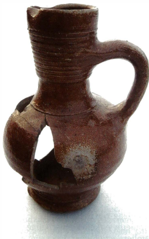
Foto van het kruikje in de huidige toestand.