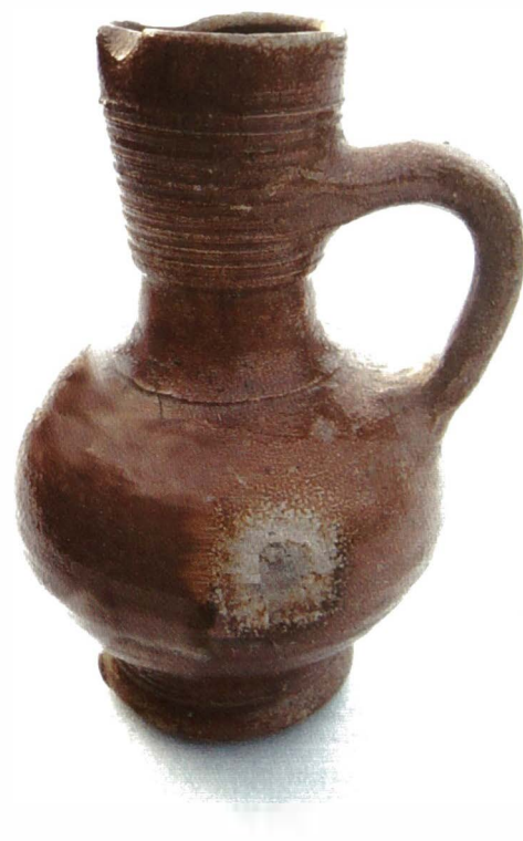
Digitale restauratie. (computerbeeld: Nico De Brouwer)