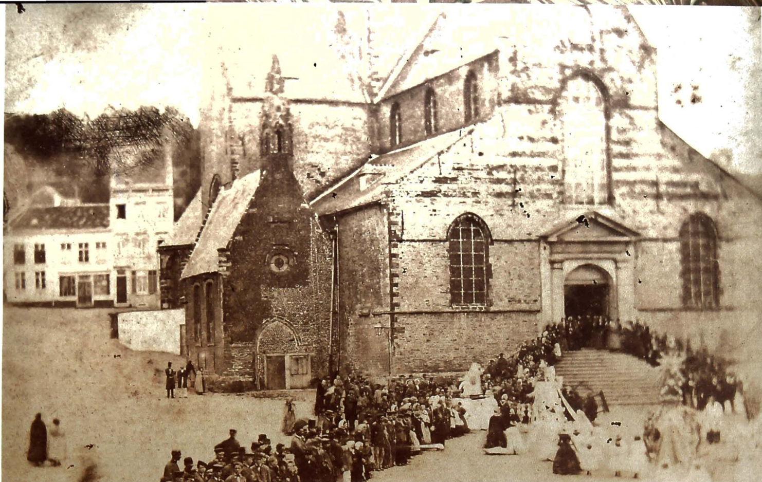
Beeldopname van de Sint-Joriskapel uit 1876. Na de afschaffing van de gilde in 1793, raakt het gebouw bij gebrek aan onderhoud in sterk verval. De spitsboogvormige toegangspoort is dichtgemetseld en vervangen door een gewone deur en dito venster. In 1870 wordt de kapel verenigd met de hoofdkerk. De restauratie komt er pas in de loop van de jaren 1890.

laars!) wordt pas vanaf de late 17 de eeuw melding gemaakt.