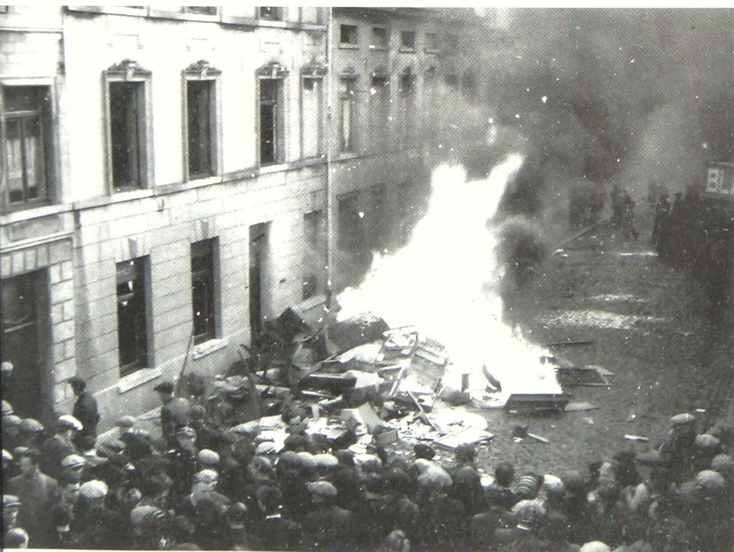
Inboedelverbranding op 3 september 1944, in de Oudenaardsestraat (foto boven) en de Verbrandhofstraat (foto onder).