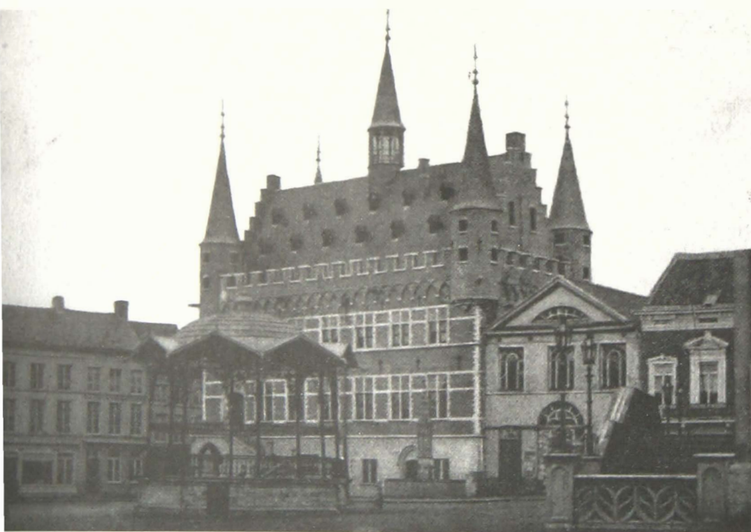
Het marktplein met middenin de kiosk zoals het er uitzag ten tijde van de bevrijding. De kiosk werd in 1965-1967 (?) afgebroken.