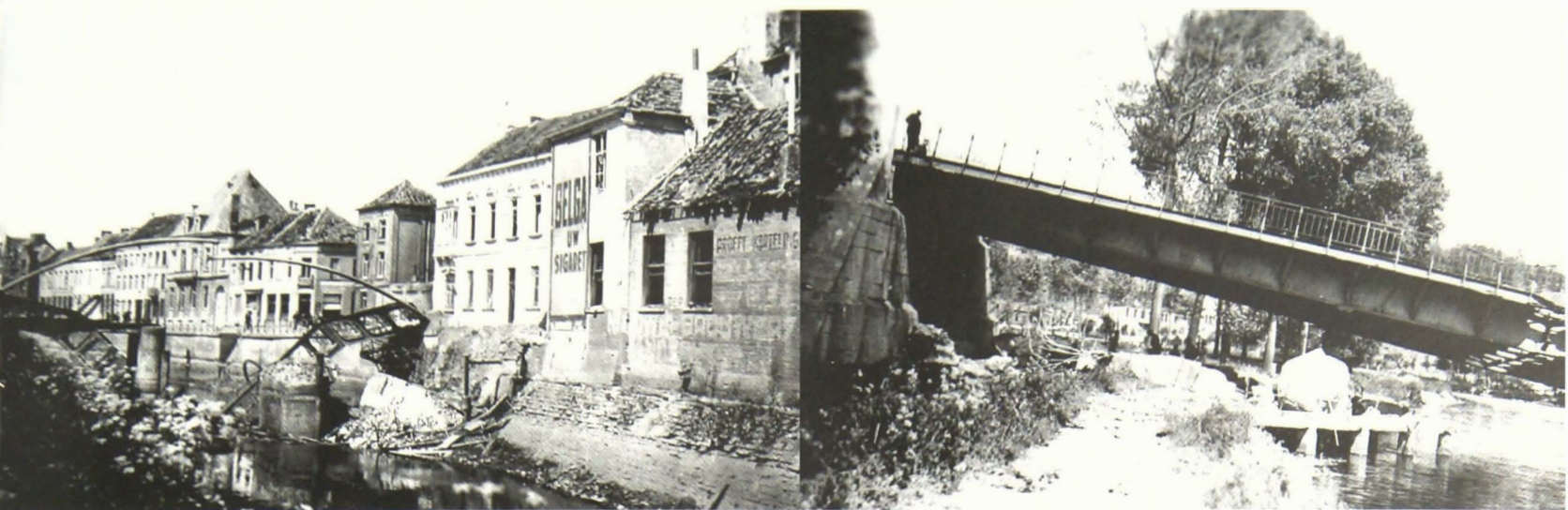
Vernielde Denderbrug in het stadscentrum en aan de Guilleminlaan

(brief, p. 3) was het een brandbom die inderdaad op de stal terecht kwam maar dan in mei 1940. De bomaanslag waarvan sprake in Volk en Staat trof niet het Vlaams Huis maar wel het café van Jef van den Bossche, lokaal van de voetbalclub Sportkring en gelegen aan de overkant van het Café Toerist en het belendende Vlaams Huis. Vermoedelijk had de aanslag te maken met het feit dat zoon Jacques van den Bossche vrijwilliger was bij het Vlaams Legioen en trouwens ook gesneuveld is aan het Oostfront (7) . De aanslag was vrij hevig want kleine brokstukken arduin werden tot aan de overkant van het marktplein geslingerd en sloegen in op de gevel van het Vlaams Huis en Café Toerist .