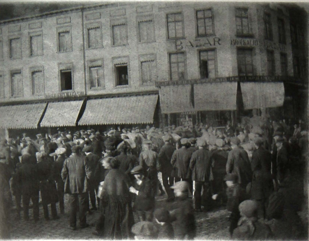
In het geheim genomen foto van de opgeëisten. Op de achtergrond Bazaar Gustave Broeckart.

Het lijkt er dus op dat zij op de goede weg zijn. Wel zijn ze bezorgd over het stijgend ongenoegen bij de stadsgenoten; de activisten kunnen namelijk hun belofte over een snelle terugkeer van de opgeëisten niet waarmaken.