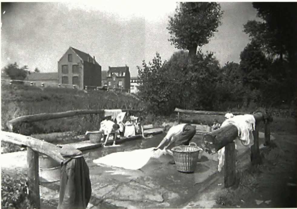
Augustus 1937: het linnen wordt nat gemaakt vooraleer het op de bleekweide wordt gelegd. Op de achtergrond de hoger gelegen Guilleminlaan en de huizen van de Kattestraat.