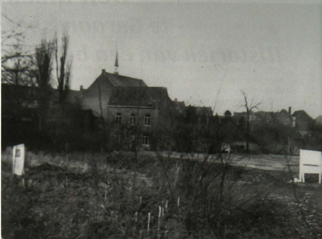
'Den Bleek' heeft hier nog een open karakter. Bemerkt op het terrein de houten plakkaten en op de achtergrond de kapel van de Congregatie Jongelingen in de Kattestraat (ongedateerd).