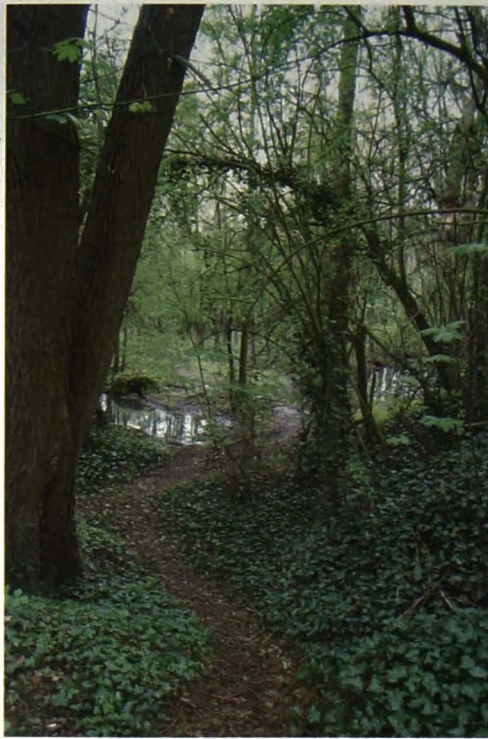
'Den Bleek' is door gebrek aan onderhoud gedurende de laatste decennia veranderd in een hoogstammig loofbos met wandelpaden (april 2012)

In maart 1988 slaat Leefmilieu Geraardsbergen alarm. Natuurbeschermers stellen vast dat op het weideperceel tussen de Guilleminbrug, de Dender en het openluchtwembad Den Bleek allerhande bouwafval wordt gestort. Het jaar voordien is het hele plantendek grotendeels vernietigd, de bovenste laag verwijderd en op een viertal grote hopen samengebracht. Op een ander perceel, langs het Dreefken , is een aantal struiken en boomstammen bedolven onder aangevoerde aarde. Hierdoor is het reliëf van het terrein met een halve meter verhoogd. De vereniging dringt er meteen bij het stadsbestuur op aan de aanvoer van bouwafval te verbieden. Ook vraagt ze tussen te komen bij het gebouwenfonds van de Rijksscholen om de verdere ophoging van het tweede perceel te verbieden. Het Geraardsbergs schepencollege geeft als antwoord dat het storten van puin bij het zwembad gebeurt ten einde de ondergrond te verharderen voor het aanleggen van wandelpaden en het plaatsen van enkele rustbanken. De gronden nabij de rijksbasisschool De Dender zijn staatseigendom en worden opgehoogd "om in de toekomst sport- en speelterreinen aan te leggen ten behoeve van de leerlingen". Uit verder onderzoek stelt Leefmilieu Geraardsbergen vast dat er voor de werken helemaal geen voorontwerp of inrichtingsplan bestaat en dat dus