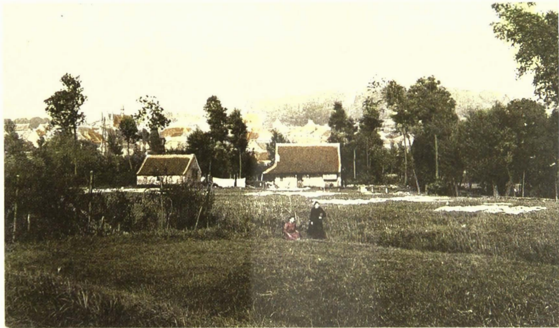
Gezicht op “Den Bleek”. Ingekleurde postkaart uit de ADF (Auguste De Frène) reeks, die dateert uit 1906. De postdatum van de kaart is 1907. Hoewel het KB van 28 augustus 1942 bebouwing verbiedt, staan op de bleekweiden tot 1912 twee ‘washuizen’.

Hoewel in Geraardsbergen het bestaan van blekerijen tot ver in de middeleeuwen teruggaat, kunnen we met zekerheid bevestigen dat Den Bleek in de 19 de eeuw hiervoor permanent dienst heeft gedaan. Stoffen van diverse aard (linnen,