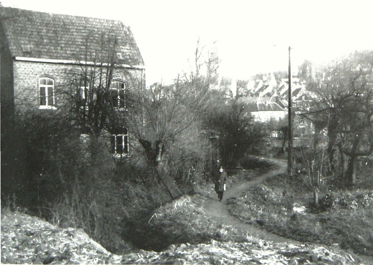
Het 'Dreefken', hier nog omzoomd met knotwilgen, loopt gedeeltelijk langs de kleine Dender, die heden ten dage ondergronds stroomt. (ongedateerd).

toen al beter bekend als Den Bleek ., als beschermd landschap geklasseerd. Dankzij deze beschermde site zou elke voorbijganger van op de nieuw aangelegde Guilleminlaan een uniek zicht hebben op de beschermde en beboste heuvel, die boven de stad uittorent.