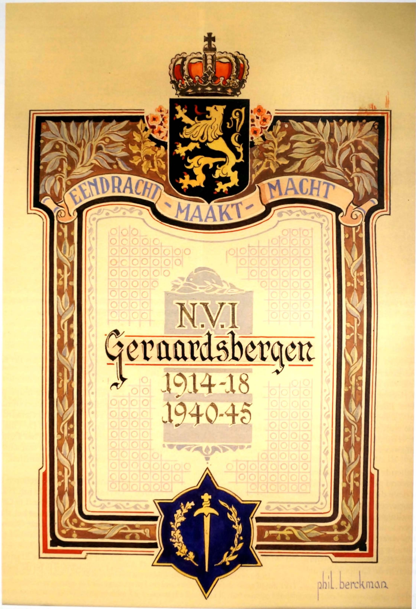
Eendracht – Maakt – Macht. N.V.I. Geraardsbergen. Geïllustreerd door Philemon Berckman. (Privéverzameling Marc van Trimpont)