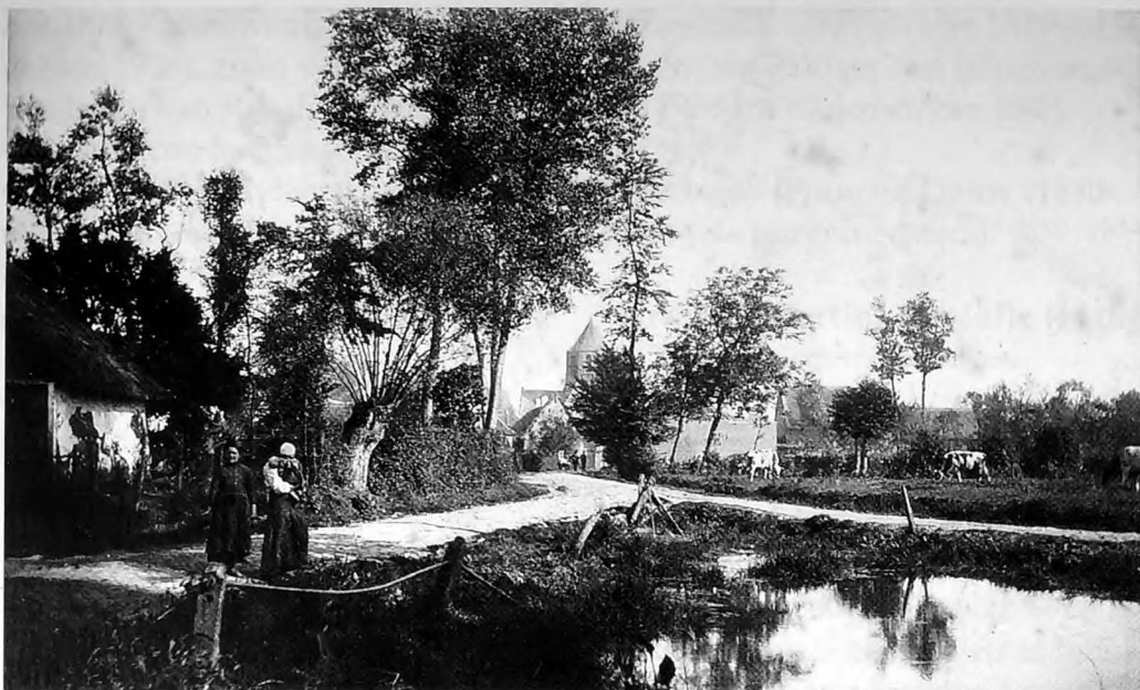
De Kamput (ca 1890): Op een kleine dries, gevormd door de Zwaanstraat (deel Hoogstraat) en de Dorpstraat (Nieuwenhovestraat), lag vroeger een natuurlijke waterplas: de Kamput. Gezien de nabijheid van de historische Schapenbaan, is het gebruik ervan door mens en dier eeuwenoud in te schatten.

trus en van Clementia Gommers, getrouwd met Helena Thollembeek, landbouwer in de Dorpstraat 2, schepen van 21 maart 1927 tot 4 januari 1939.