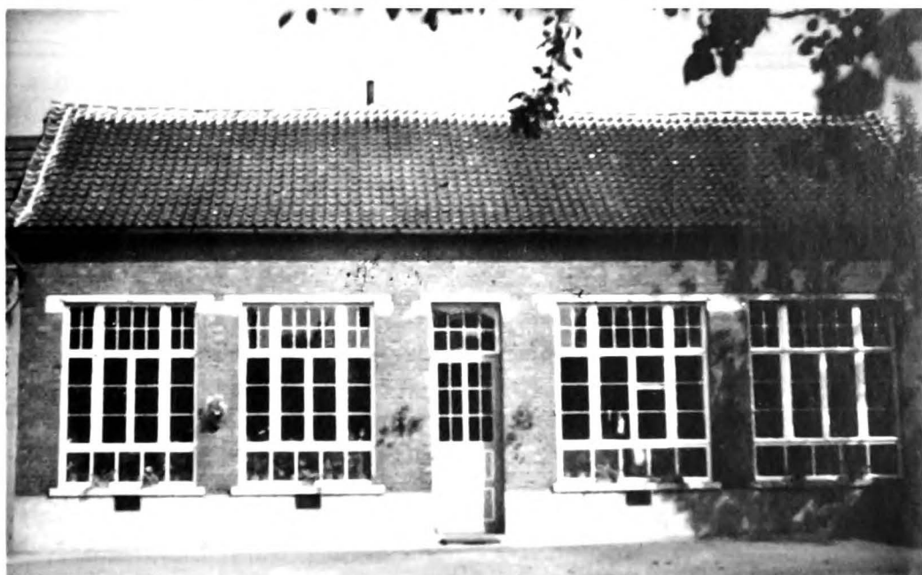
De zusterschool (1930): De oude kloosterschool bestond uit slechts twee klaslokalen: links een kleuterklas en rechts een lagere klas.