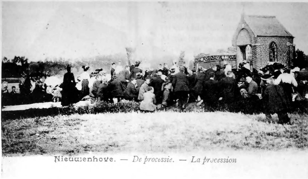
Nieuwenhove. — De processie. — La procession

De processie (1910): Om het wenen van kinderen te stoppen, gingen wanhopige ouders ter bedevaart naar Nieuwenhove. Op Sacramentsdag ging een processie rond in het dorp. We zien die druk bijgewoonde optocht hier aan de kapel van de Heilige Anna.