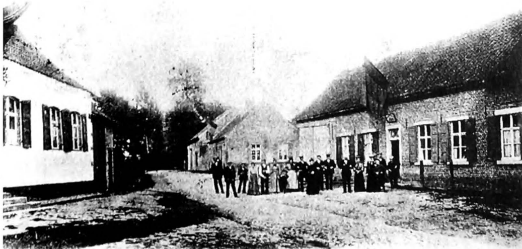
Nieuwenhove. — De groote plaats. — La grand'place