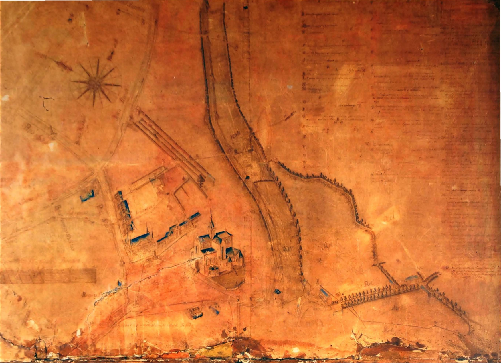
Figuratieve kaart van de waterleidingen op het stadsplan van Geraardsbergen door Petrus Capeau (1783).

bergen beslaat zes pagina's. Voor zijn opzoekingen duikt Boone in het de archieven van Geraardsbergen. Naast een aantal rekeningen van het einde van de 15 de eeuw heeft hij tevens de periode van de 18 de eeuw doorzocht. In een kwitantie van 1783 vindt Boone meldingen van de opmetingen van de onderaardse goten en waterleidingen der stadsfontein met als doel "het formeren een kaerte ofte een plan". Daarbij vermeldt hij dat hij dit plan jammer genoeg niet heeft teruggevonden. (11) Op te merken valt dat Boone vooreerst te weinig tijd neemt om een grondiger onderzoek te verrichten "enigszins noodgedwongen: Zeitszwang!" geeft hijzelf aan op pagina 152. Maar tevens valt uit zijn studie op te maken