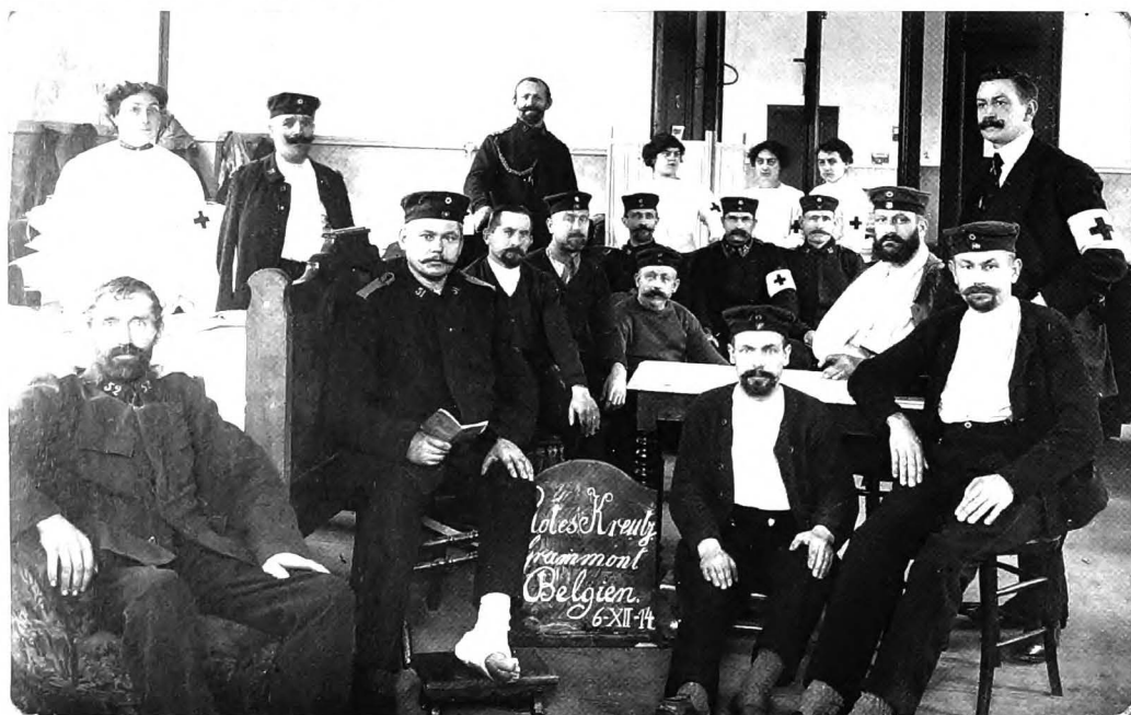
Soldaten ver van huis. Rotes Kreuz Grammont, Belgien 6-XII-1914.