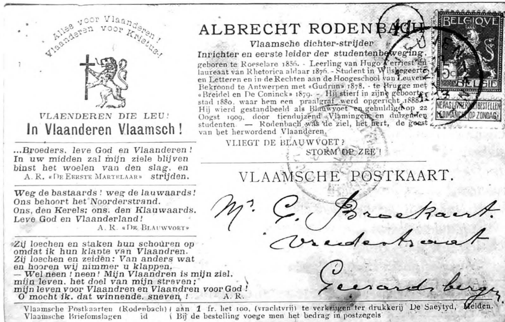
Vlaamsche Postkaart. Vlaanderen die Leu! In Vlaanderen Vlaamsch! Deze postkaart ondersteunt de strijd voor het Vlaamsche gedachtegoed: Vliegt de Blauwvoet? Storm op Zee! [Datumstempel 1917]