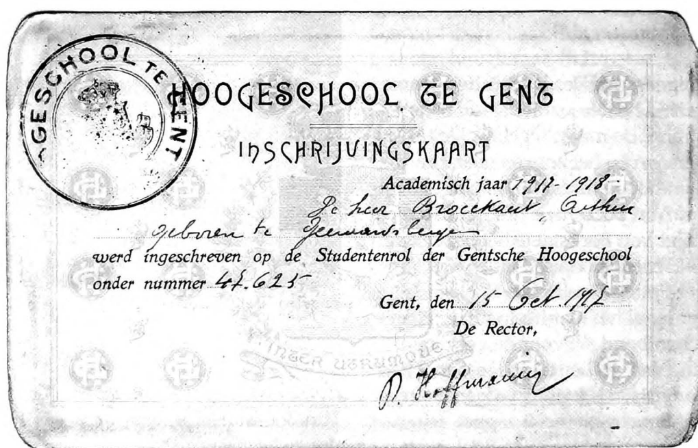
Inschrijvingskaart voor het academisch jaar 1917-1918.

Dit initiatief sluit aan bij het concept van de bestuurlijke scheiding dat in de Flamenpolitik (49) is opgenomen en past dus perfect in de strategie van gouverneur-generaal Von Bissing. De Jong-Vlamingen dromen van bij het begin van een zelfstandige staat Vlaanderen en onderhandelen al snel met de gouverneur-generaal (50) over een mogelijk toekomstig statuut voor Vlaanderen. In de zitting van de Raad van Vlaanderen van 22 december 1917 wordt de onafhankelijkheid van Vlaanderen uitgeroepen (51) . Zoals gezegd kadert dit in de