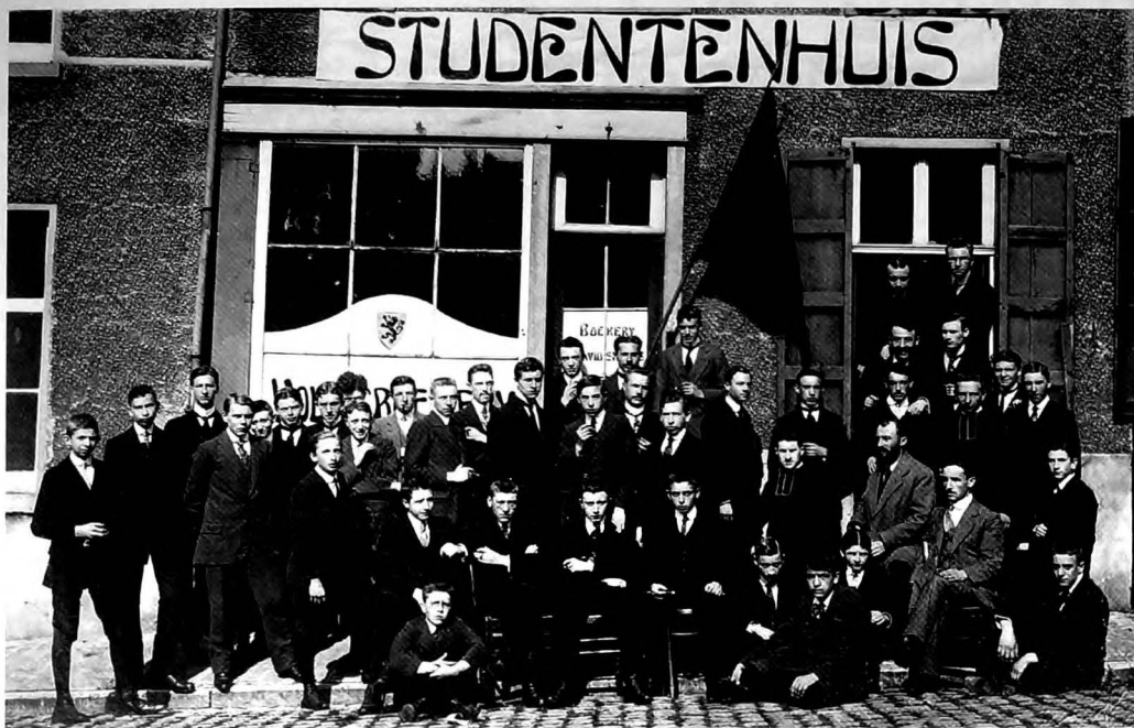
Studentenhuis, Boekerij Davidsfonds.