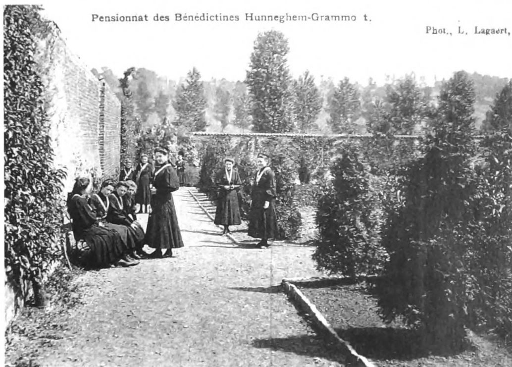
Pensionnat des Bénédictines Hunnegem-Grammont.