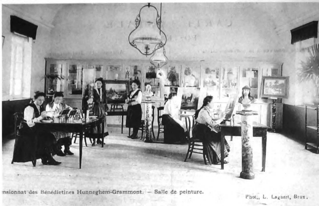
Pensionnat des Bénédictines Hunnegem-Grammont. — Salle de peinture.

De onderwijsstaf is zeer bekwaam. Het onderwijs zelf: dé basis voor een verfijnde opvoeding. Bijzondere aandacht wordt terloops gevestigd op het borduur- en speldenwerk (kantklossen) dat aangeleerd wordt. Daarenboven kunnen meer kunstzinnige leerlingen zich bekwaamen door deelname aan grafische en/of muziekoopleidingen. Tenslotte, en uiteraard, worden de jonge dames klaargestoomd