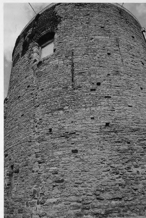
De ‘Dierkost’ wordt tijdens de 15 de eeuw tijdelijk gebruikt als archiefdepot. Hier de toren gezien langs de veldzijde (2010)

Hoewel ook tijdens de twee volgende eeuwen de Oudenbergstad niet gespaard blijft van oorlogsgeweld en vernielzucht, slaagt de magistrat er telkens in de stadsarchieven in veiligheid te brengen. Vinden we voor de stadsrekeningen tijdens de jaren 1400 nog heel wat hiaten, vanaf 1508 en dit tot de inval van