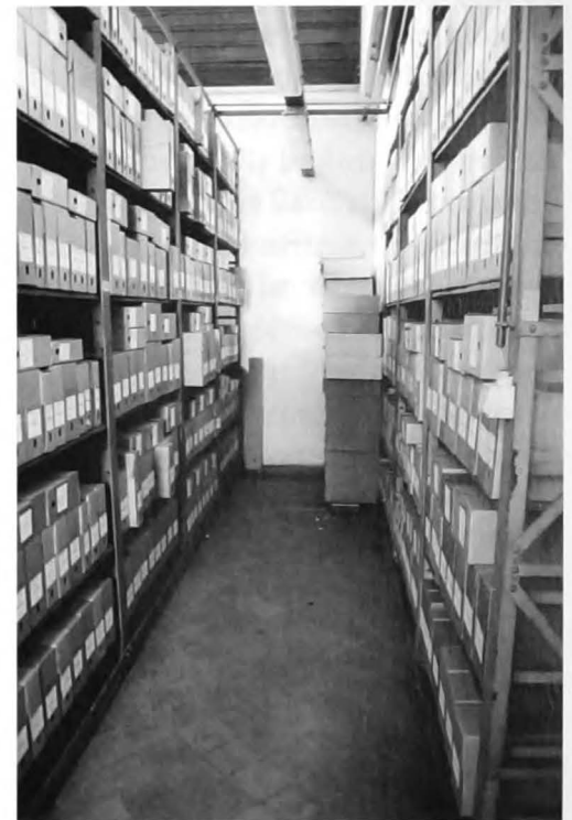
Het oud gemeentelijk archief van Geraardsbergen vindt, na een verblijf van 45 jaar in het Rijksarchief te Ronse, in 2009 haar plaats terug hier in de rekken van het Gentse Geraard de Duivelsteen.