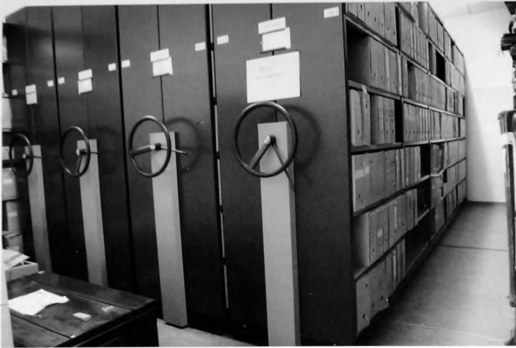
Het Administratief Centrum in de Weverijstraat telt twee kleine archiefruimten waar vooral bevolkingsregisters worden bewaard.

2009 de sluiting bekrachtigen. Inderhaast moet de archiefdienst naar een nieuwe locatie uitkijken. Er wordt voor een tijdelijke oplossing geopteerd. De moderne archieven worden voor een onbepaalde duur overgebracht naar het Rijksarchief Beveren-Waas, terwijl alle microfilms terecht komen in het Rijksarchief Kortrijk (17) . Wat wel definitief wordt is het deponeren van alle oude archieven van het gerechtelijk arrondissement Oudenaarde in het Rijksarchief Gent. Hierdoor vindt het oude archief van Geraardsbergen na 45 jaar opnieuw zijn plaats op de rekken van het Geraard de Duivelsteen. Er zijn bouwplannen gemaakt voor een nieuw rijksarchief in de Arteveldestad tegen 2011-2012 waarin een groot aantal Oost-Vlaamse rijksarchieven zouden worden ondergebracht. Het blijft vooralsnog bij plannen want nu blijkt dat het beoogde