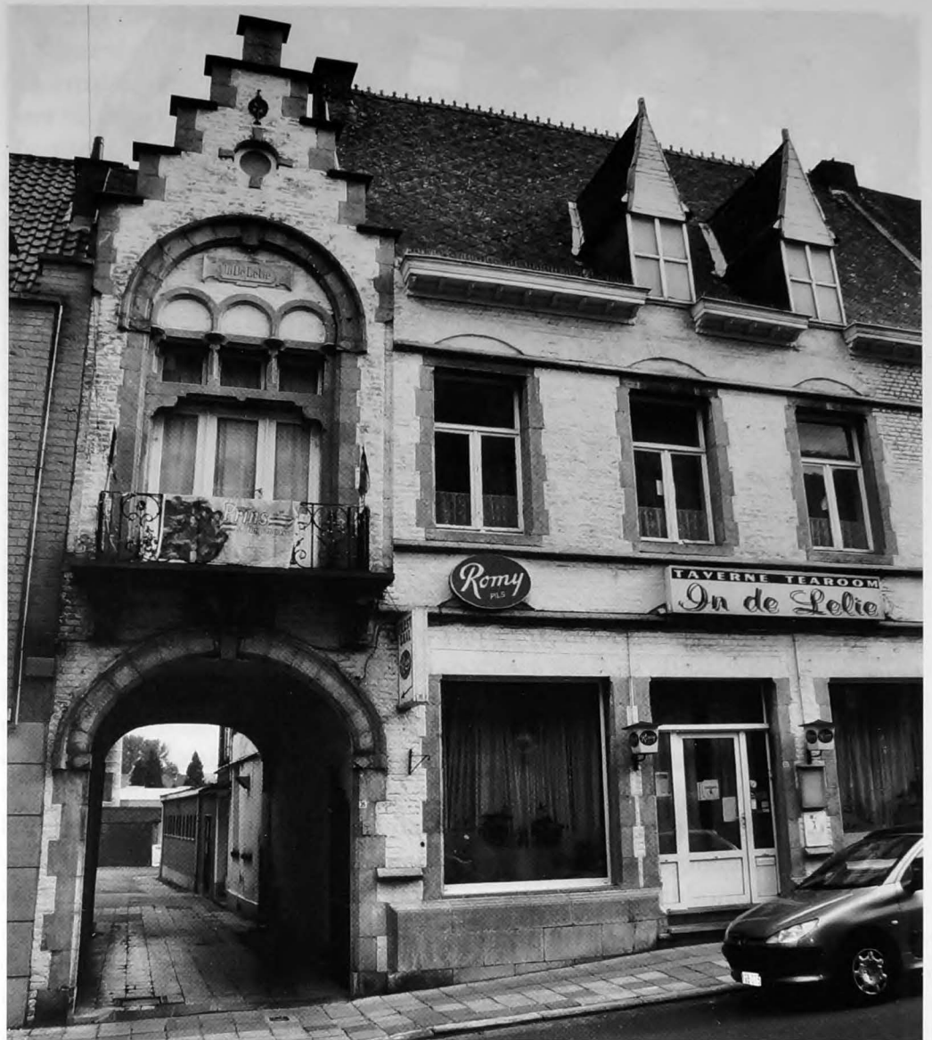
In taverne-tearoom 'In de Lelie' met zijn historische gevel uit 1883 vond ooit de verzameling van Erik Bartels een onderkomen, maar wordt nu geïntegreerd in het nieuw geplande bibliotheek- en archiefproject.

Doordat de Stadsbibliotheek in de Gasthuisstraat verouderd en te klein is geworden, plant het stadsbestuur tegen 2012 een nieuwe bibliotheek op de site tussen de Weverijstraat, de Denderstraat en de Zakkaai. Een voorlopig ontwerp is goedgekeurd en in september 2010 wordt de bouwaanvraag ingediend in de hoop eind maart 2011 met de bouw te kunnen starten. De Stadsbibliotheek is een ontwerp van architect Koen Van Der Mynsbrugge en wordt omschreven als "een laagdrempelig cultuurhuis, met veel lichtinval zodat boeken en mensen heel duidelijk zichtbaar zijn". Het gebouw wordt sober opgevat met een foyer waar kleine expo's mogelijk zijn, een ruime leeszaal en een onderkomen voor de leesclub. Daarnaast komt er een kunsten- en een archiefdepot waar de stukken uit zowel gemeentelijk, parochiaal als OCMW-archief onderdak vin-