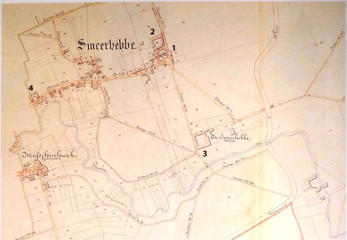
Smeerebbe volgens de Atlas der Buurtwegen - 1841. Op het plan zijn de volgende gebouwen genummerd: 1. de kerk; 2. het pachthof Van Crombrugge (eigenaar familie Mulle - Gent); 3. het pachthof Te Berchem (eig. Hypollitte Lammens - Gent); 4. de hoeve van Pieter Frans (later Francis) De Waegeneer.