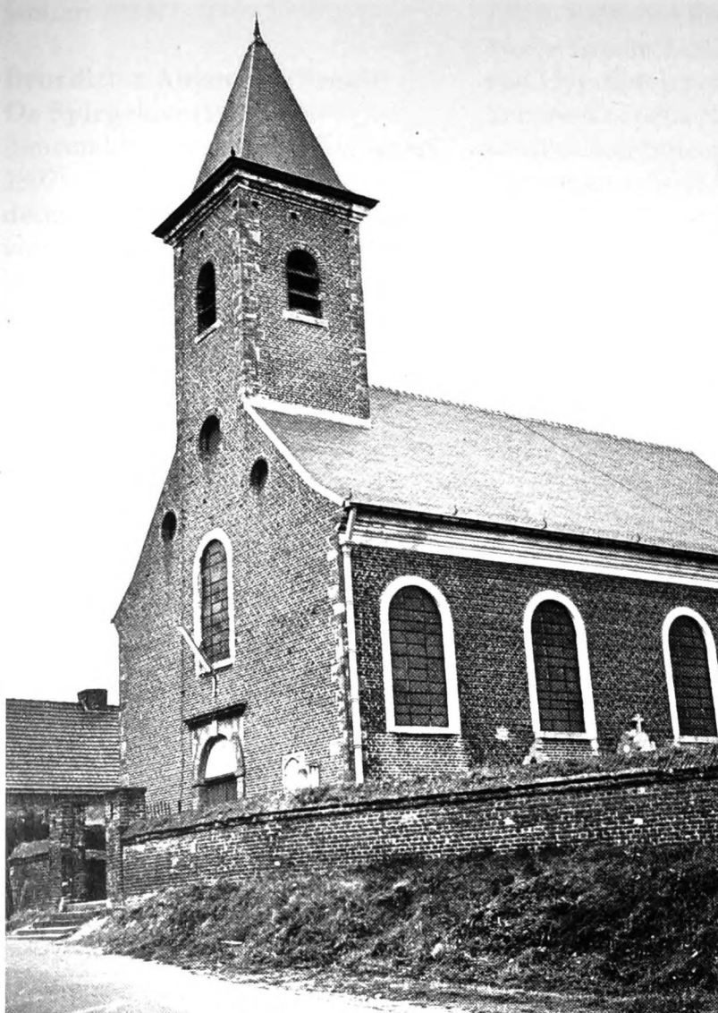
Sint-Amanduskerk Smeerebbe - 1911. Het zaalkerkje met westtoren en schip dateert uit 1792-1794. Het klein gotisch koor en de sacristie zijn een paar eeuwen ouder. De kerk is omringd door een kerkhof met een bakstenen muur. In de kerk bevindt zich een merkwaardige, veertiende-eeuwse hardstenen doopvont.