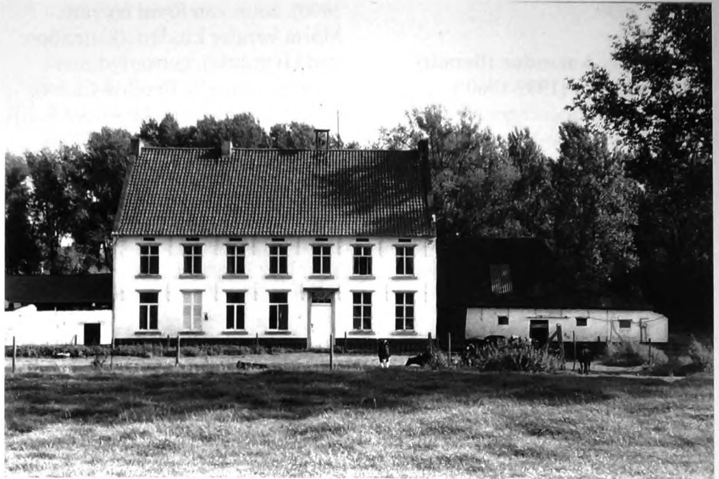
Het hof te Berchem – 1991. Aan de voet van de 'Smeerebbeberg' ligt het hof te Berchem, ooit een vooruit geschoven 'missiepost' van de Gentse Sint-Pietersabdij. Het woonhuis, een witgekalkt dubbelhuis met klokkenruiter en windijzers, dateert volgens een jaaranker in de hier zichtbare achtergevel uit 1835.