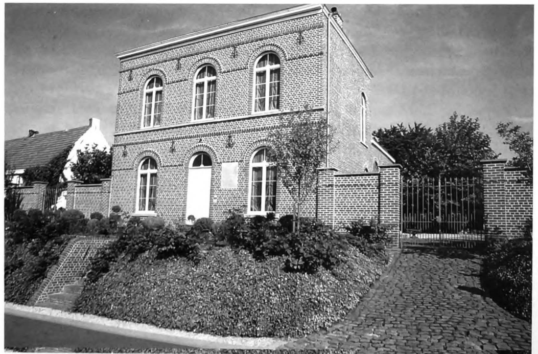
Dorpsschool Smeerebbe - 2008. Het dorpschooltje, dat ook dienst deed als woning van het schoolhoofd en later als gemeentehuis, werd gebouwd in 1867 naar een ontwerp van architect E. Van Hoecke-Peeters. Het tweelaags schoolhuis is hoger gelegen dan de straat en wordt bereikt via een bakstenen trap. Achter het schoolhuis is het éénlaags schoollokaal aangebouwd. Links ervan ligt een geplaveide speelplaats. Het geheel is enkele jaren geleden met veel aandacht voor de authenticiteit gerestaureerd.

(Voorde 25 september 1803 - Smeerebbe-Vloerzegem 27 september 1882), zoon van Willem (burgemeester 1826-1830) en van Victorine Vandenborre, getrouwd met