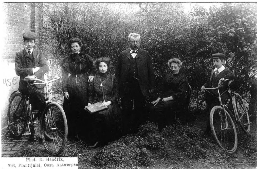
Wie kent deze foto? Op de achterzijde van de postkaart staat: Familie Mehauden Zarlarding. Over welke familie gaat het? De foto is rond 1900 gemaakt.

freddy.de.chou@geraardsbergen.be of redactie@gerardimontium.be