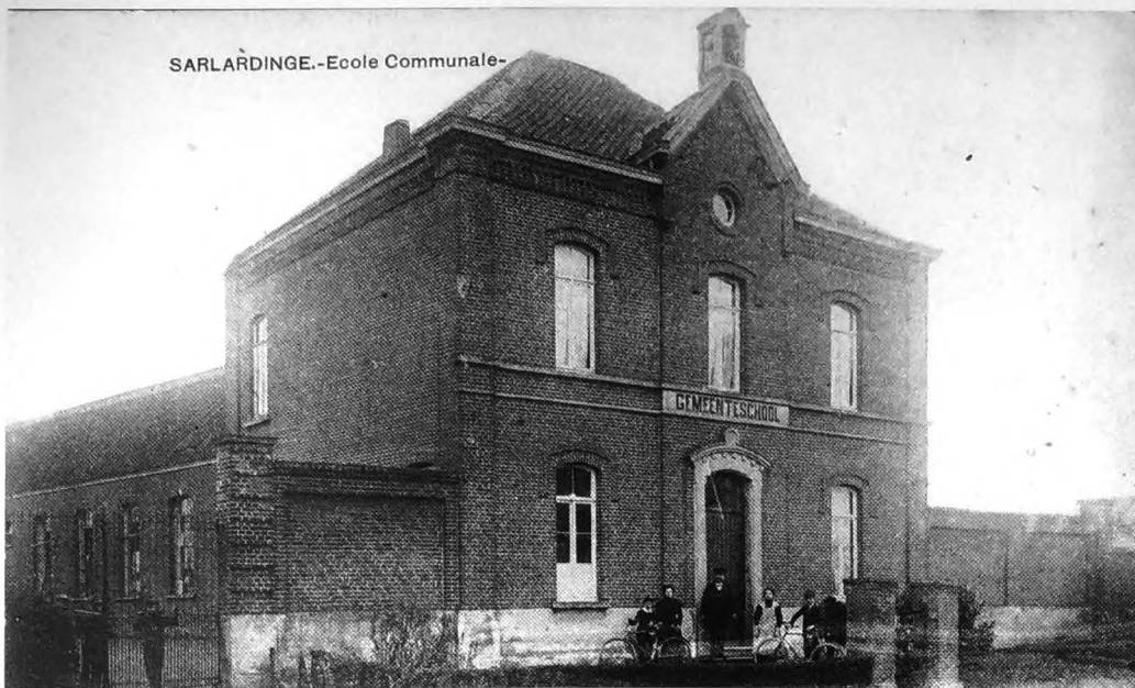
Gemeenteschool - 1926. In 1844 erkent de gemeenteraad de school van Charles Louis Defraigne als gemeenteschool. De postkaart toont vlnr. de gemeenteschool, het gemeentehuis en het schoolhuis zoals ze in 1871 werden gebouwd. In 1950 worden de gebouwen grondig herschikt en in 1976 omgevormd tot gemeentelijke feestzaal.