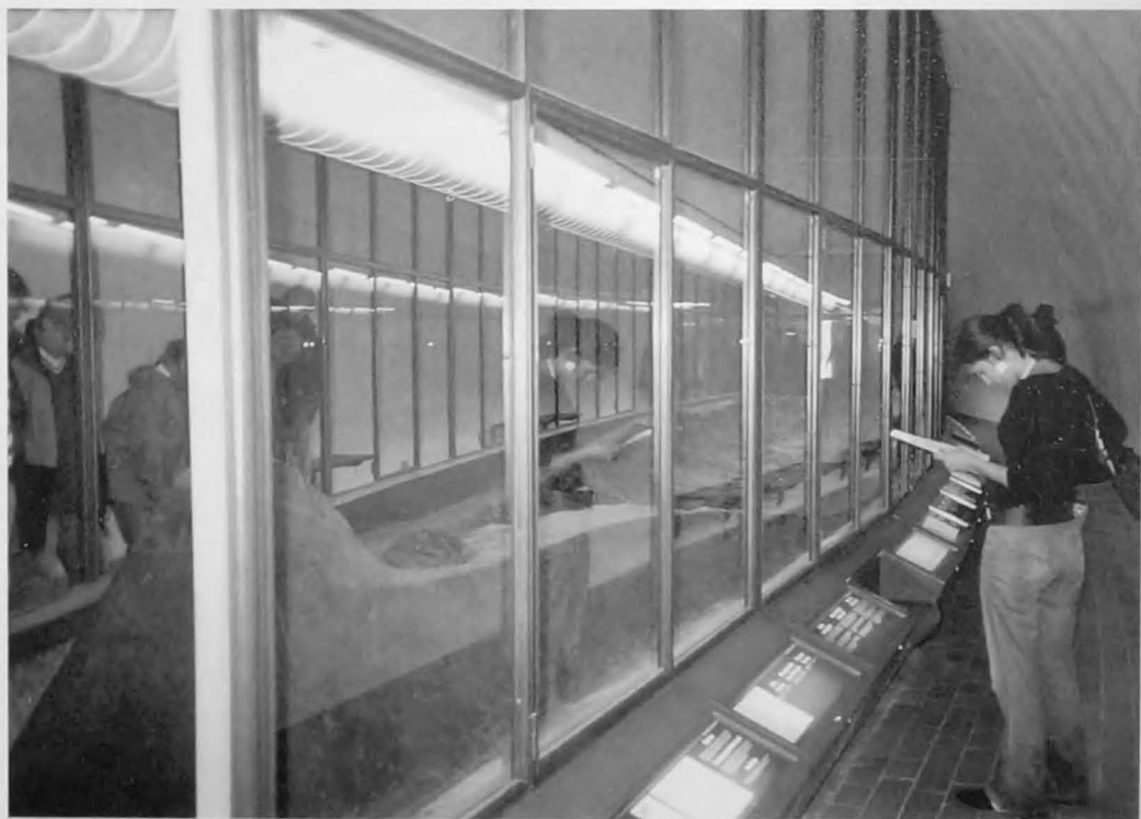
Binnenin de grafheuvel van Kerteminde kunnen de gevonden grafresten, waaronder sieraden en een boot, bewonderd worden.