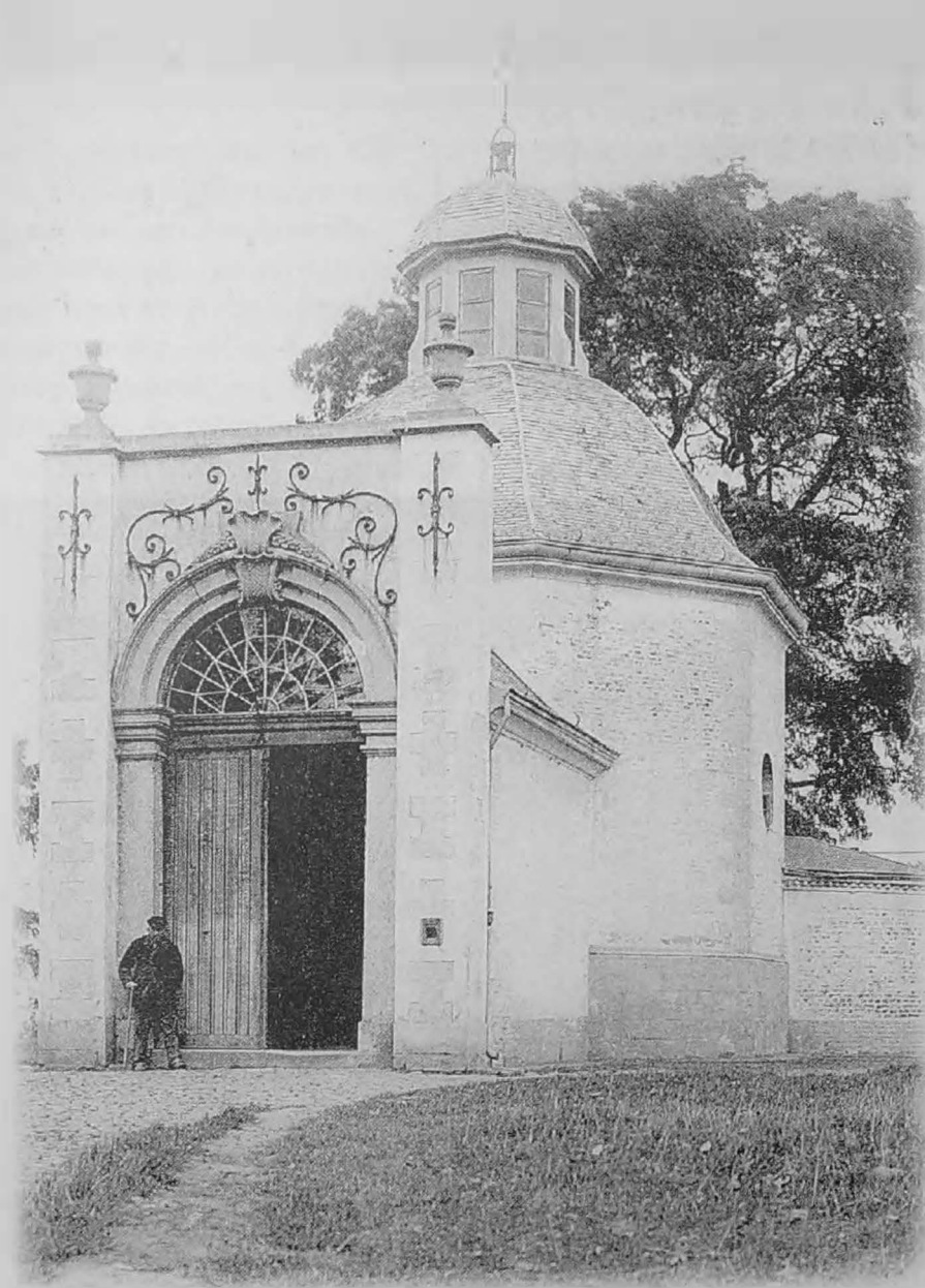
Op deze oude postkaart zien we nog de kapel opgebouwd in 1724 maar die in juli 1905 gedeeltelijk is afgebroken, verruimd en vervangen door een nieuwe zoals we die vandaag nog kennen.

voertuig met op hol geslagen paarden raast in volle vaart van de berg maar komt beneden veilig tot stilstand... Dit gebeuren is vastgelegd op een schilderij, dat in de kapel ophangt (8) .