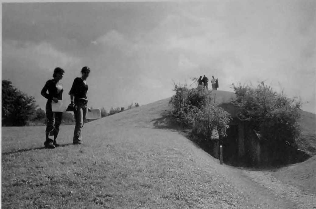
Deze grafheuvel in het Deense Kerteminde met toegang voor het publiek heeft zijn geheimen prijsgegeven.