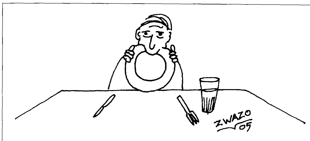
Zan talluere opeten

teik pier, aardworm "De kiekisj za zot ver nen teik te vennen."