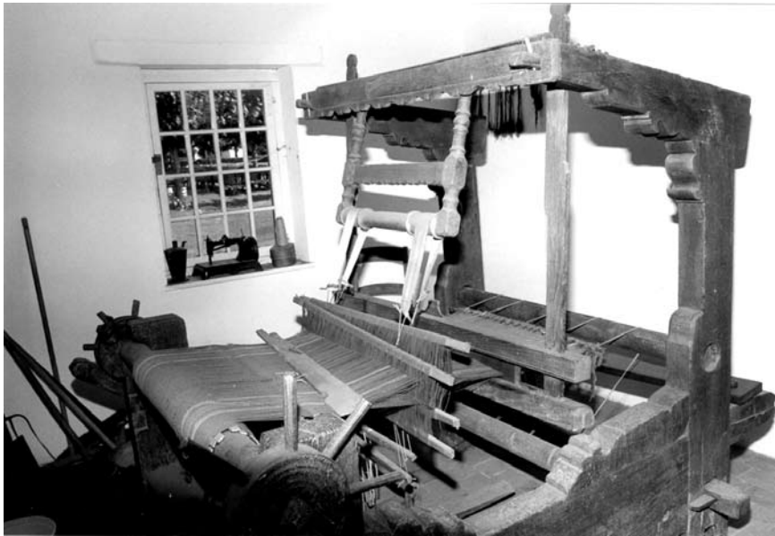
Afb. 5: Een houten handweefgetouw in het Heemmuseum Eeklo, Provinciaal Domein Het Leen (2004)