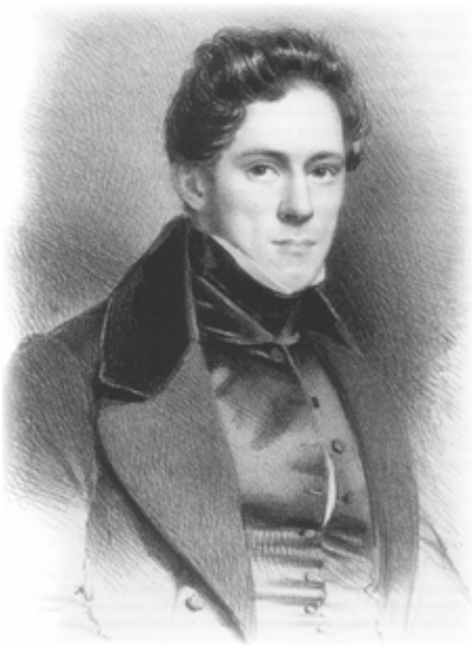
Afb. 3: Edouard De Jaegher is van 1 september 1848 tot 4 juli 1871 gouverneur van Oost-Vlaanderen