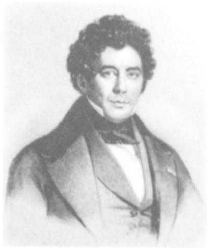
Afb. 2: Charles Rogier is van 1847 tot 1852 Eerste Minister en minister van Binnenlandse Zaken

Anders is het gegaan met de overheidssteun aan noodlijdende