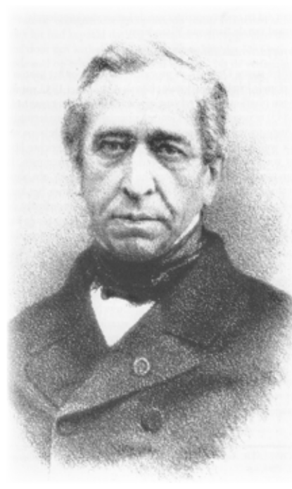
Afb. 1: Auguste De Cock is van 12 augustus 1847 tot 1 september 1848 gouverneur van Oost-Vlaanderen ad interim

In het najaar van 1847 wordt vanuit de Belgische regering een bedrag van 500.000 Belgische frank vrijgemaakt om de verpauperde bevolking in de steden en de gemeenten tijdens de wintermaanden te ondersteunen. Deze financiële tegemoetkoming is voor het stadsbestuur van Geraardsbergen onontbeerlijk, want de stadskas is quasi leeg. Op 27 oktober 1847 ontvangt Auguste De Cock (3) (afb. 1), gouverneur