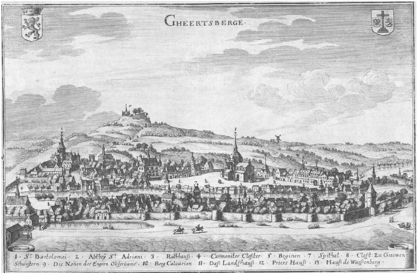
Afb. 3: uit Topografia Germania van Riedel-Merian

de rijhuizen, de windmolens, landerijen, stadspoorten en -wallen, de Dender en de twee bruggen erover die linker- en rechteroever met elkaar verbinden. Om geen "abstracte" afbeelding te publiceren worden op de voorgrond van het zicht enkele personages opgevoerd die samen met het omliggende landschap en de wolkenformaties voor levendigheid moeten zorgen. Dit is uniek in het oeuvre van Sanderus-Blaeu!