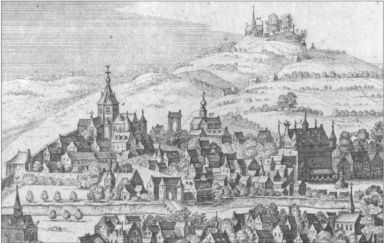
Afb. 5: detail linkerhelft van 'de Sanderus'