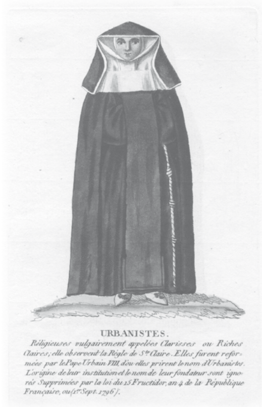
Afbeelding van een Urbaniste