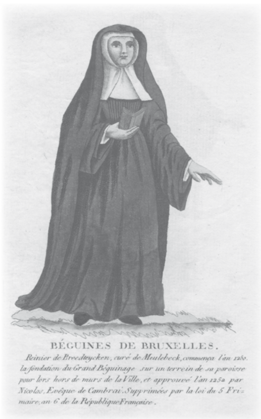
Afbeelding van een (Brusselse) begijn