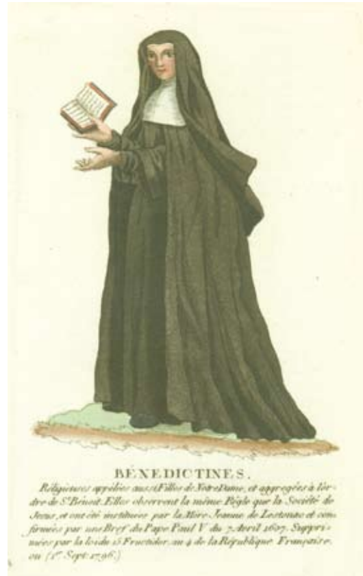
Afbeelding van een Benedictines