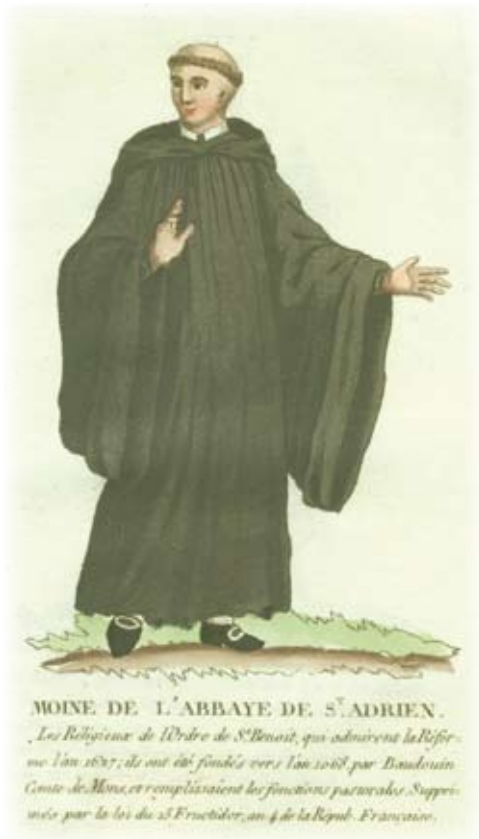
Afbeelding van een monnik uit de Sint-Adriaansabdij (18 de eeuw)