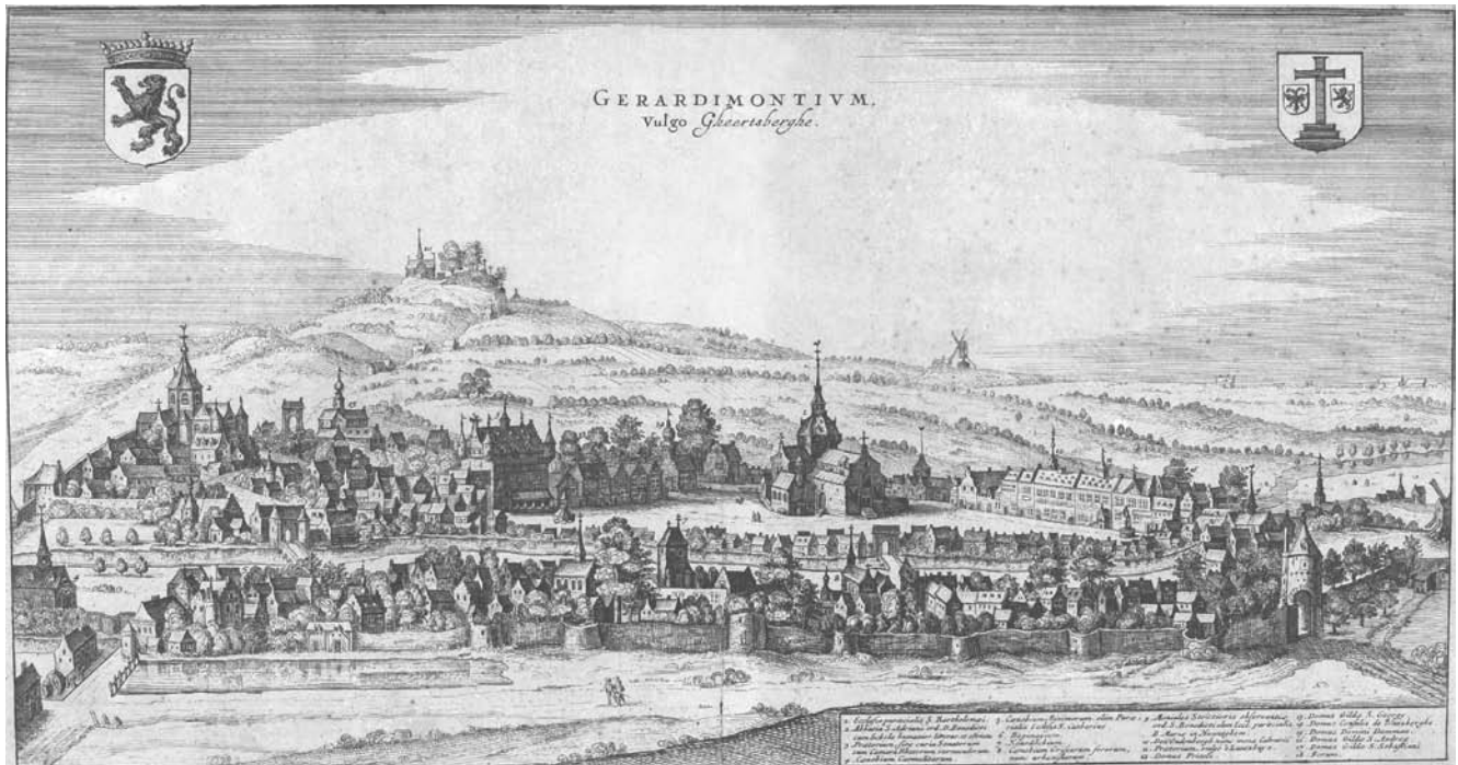
Afb. 1: uit Flandria illustrata (1644) het originele, eerste zicht. In de Nederlandse vertaling, Verheerlykt Vlaendre , is de titel bovenaan weggelaten