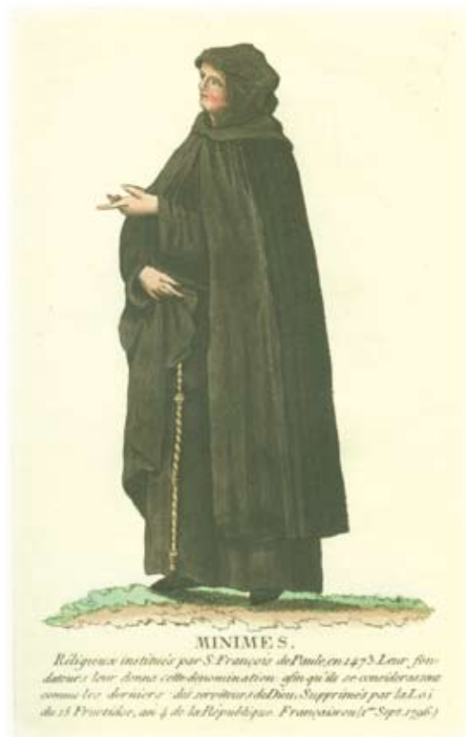
Afbeelding van een monnik van Sint-Franciscus a Paulo of Miniem