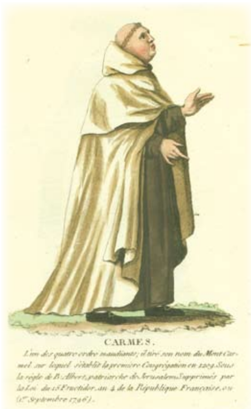
Afbeelding van een monnik van de orde der Karmelieten