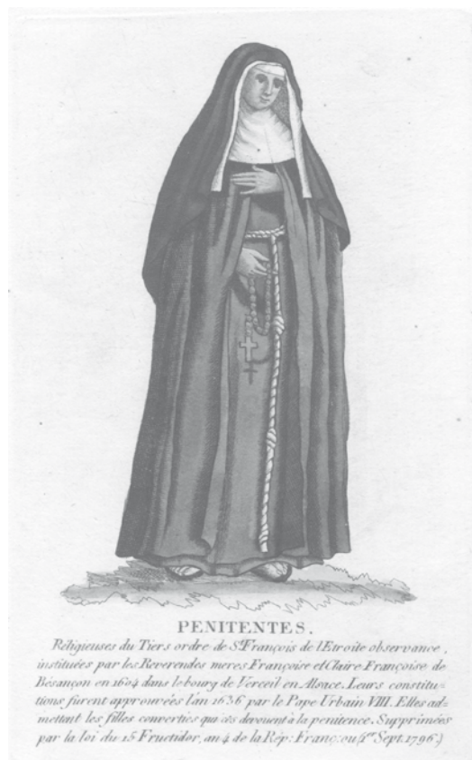
Afbeelding van een Penitentes