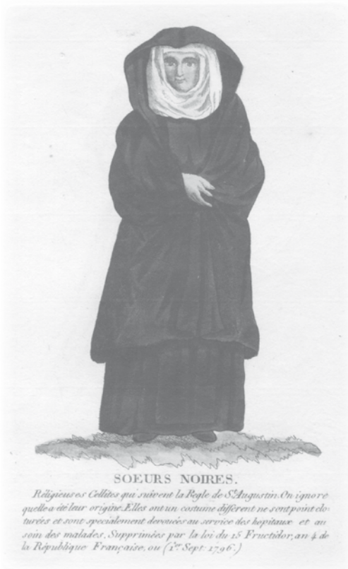
Afbeelding van een Zwarte Zuster