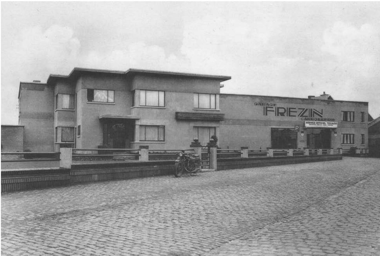
Afb. 1: Een bom valt op 22 mei 1944 nabij Etablissements FREZIN Garage-Carrosserie (gebouwen van het vroegere lucifersbedrijf S.A. Triumph Matches) in de Papiermolenstraat