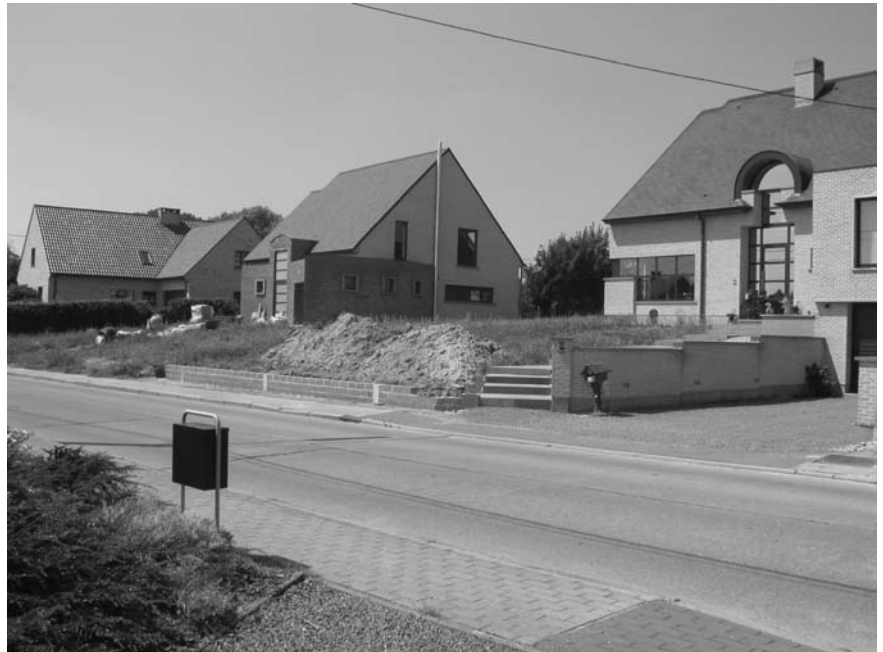
Afb. 2: Op de plaats in Waarbeke waar op 11 mei 1944 een smeulende brandstoftank neerplofte, is recent een nieuwe woning opgetrokken