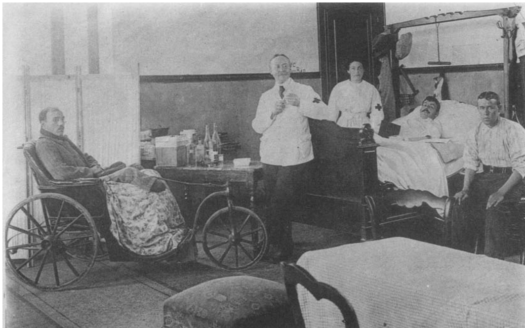
Afb. 3: De zaal met de zwaar gekwetsten met centraal de hoofdgeneesheer

medische personeel (verplegers, ziekendragers, dokters), de gekwetste soldaten en het interieur van de ziekenzalen (afb. 3 & 4) anno 1915. Op het herdenkingsfeest van de bevrijding van Geraardsbergen in 1944 tijdens het eerste weekend van september hebben overigens belangstellenden deze foto's vergroot kunnen bewonderen op de stand van het Rode Kruis.