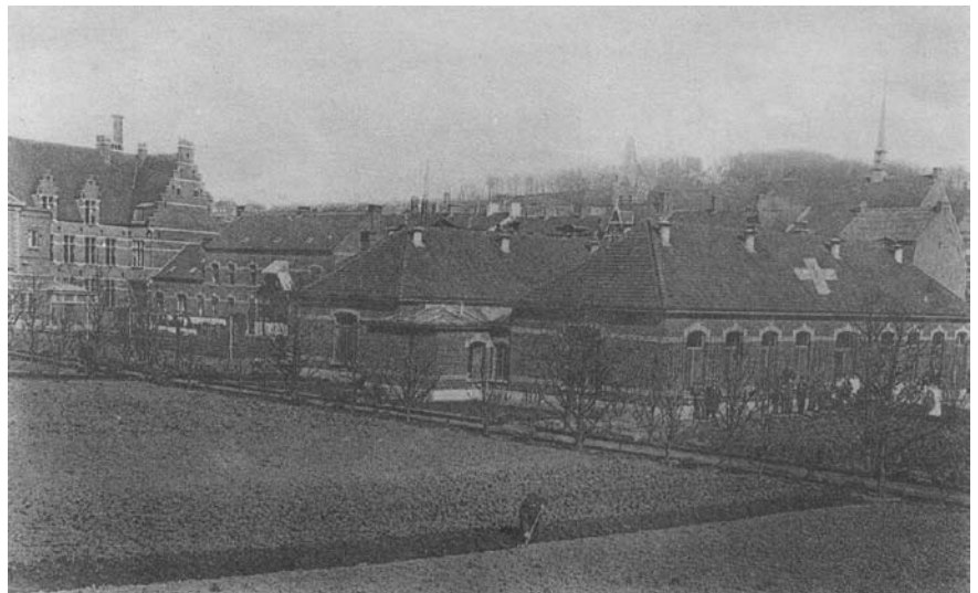
Afb. 1: het Veldhospitaal van het Rode Kruis in de gebouwen van het Lazareth, een verdwenen vleugel van de vroegere Burgerlijke Godshuizen langsheen de Kattestraat

Maar er is nog een derde luik in de opvang en vooral de nazorg van de soldaten die gekwetst van het front komen. Het zogenaamde Comiteit van Hulp en Vakonderwijs aan de Verminkten van den Oorlog wordt tegelijkertijd in het leven geroepen. Welke mensen hier precies bij betrokken zijn, blijft